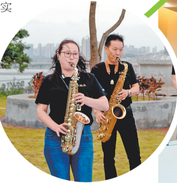
▲老年乐队奏响晚年幸福之歌

艺术活动与健康的关系比很多人想象中的更紧密。培养一种艺术方面的兴趣爱好，既有助于患者缓解病痛，也是养生之道。从一场南音、一炉香、一幅字、