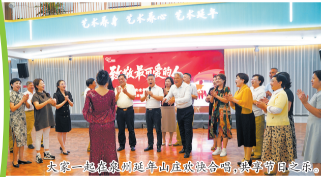
大家一起在泉州延年山庄欢欣合唱，共享节日之乐。

写作能赶走空虚感，帮肿瘤患者重燃信心。研究表明，做笔记可提高记忆力和理解能力。写东西前要学习，要收集材料，要分析研究，要认真构思，是一个体力脑力并用的过程。无聊的时候写作，还可以帮助赶走空虚感，让人更充实。情绪不佳的时候写作，消极情绪在字里行间就会逐渐消散。对于肿瘤患者，文字表达对发泄愤怒、恐惧、担忧、孤独等负面情绪有很大帮助，通过分享个人经历，还能找到很多伙伴，更能为其他病友起到正向引导作用。