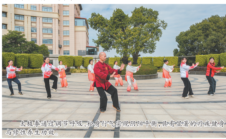
太极拳通过调节呼吸、松身行气实现阴阳平衡，具有显著的养身健身与修性养生功效。