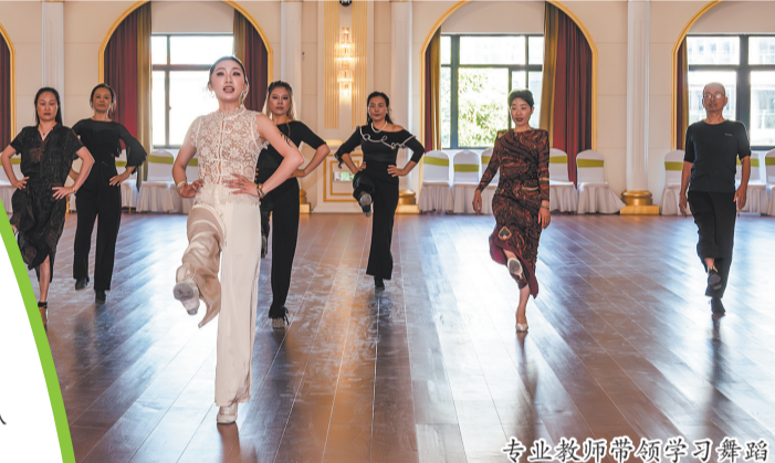
专业教师带领学习舞蹈