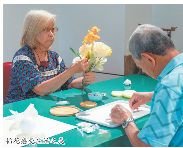
插花感受生活之美