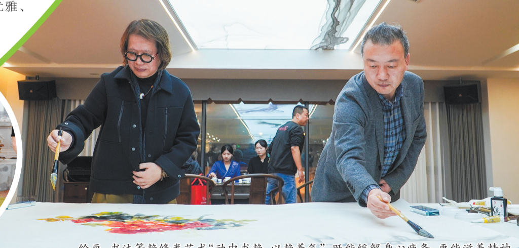
绘画、书法等静修类艺术“动中求静、以静养气”，既能缓解身心疲惫，更能滋养精神