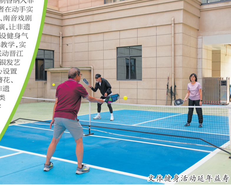
文体健身活动延年益寿

一套拳，到系统化、专业化、普惠化的艺术养老生态；从社区街头的零散体验，到延年山庄等养老机构的标杆探索，文化艺术滋养生命、守护健康，让每一位长者都能在雅韵中安心、在笔墨中静心、在香韵中舒心，活出健康、优雅、有温度的晚年。