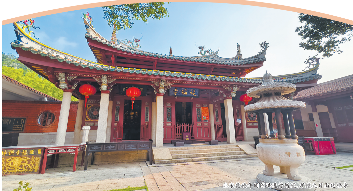
北宋乾德年间陈洪进曾增筑,扩建九日山延福寺