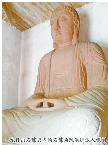
九日山石佛岩内的石佛为陈洪进派人雕刻

为了向北宋进贡,陈洪进曾向泉、漳百姓征收重税,导致二州百姓数年内生活艰难。但他也改革治理弊端,整顿田赋制度,减轻部分百姓的负担;在推动海外贸易方面,他进一步完善泉州港口设施,延续并发展了留从效时期的海外贸易政策,使泉外商人越来越多,市场进一步繁荣,中外经济文化交流也更为频繁,为后来宋元泉州成为“东方第一大港”奠定了基础。陈洪进还是位颇具名士风度之人。治泉