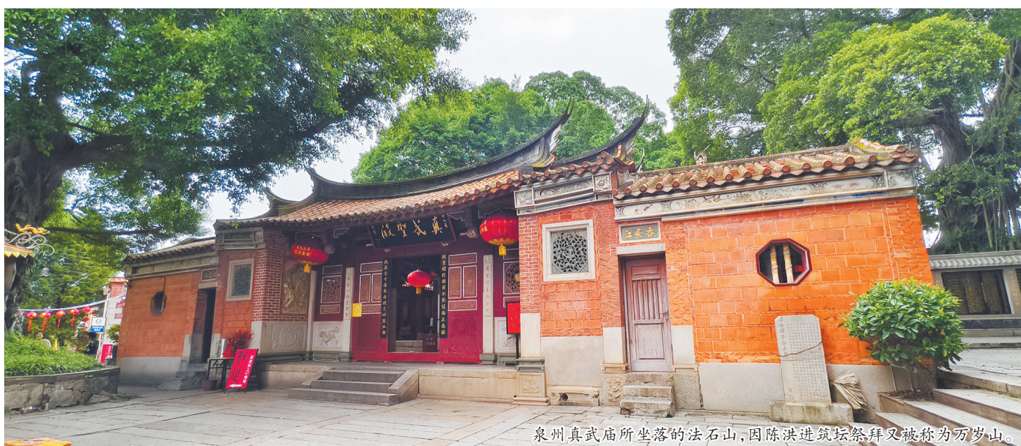
泉州真武庙所坐落的法石山,因陈洪进筑坛祭拜又被称为万岁山

然而,后周显德七年(960)发动陈桥兵变的赵匡胤实在太能打了,他仅用三四年便扫荡了山西、湖南、湖北的大部分地区以及江苏部分地区,明代黄仲昭《八闽通志》:“时宋太祖(赵匡胤)平泽、潞,下扬州,取荆湖,威震四海。”陈洪进惧怕宋军,建隆三年(962)底,即遣衙将魏仁济向赵匡胤奉表纳款,建隆四年(963)又遣使两人朝贡。这等于绕过南唐,直接向北宋称藩。此举博得了赵的认可。宋太祖于是颁令,改清源军为平海军,授陈洪进平海军节度使,泉漳等州观察使,检校太傅之职。这下陈洪进有了两个身份——既是南唐的“老臣”,又是宋朝的“新臣”。如此一来,也在乱世中维持了泉、漳地区的安局面。