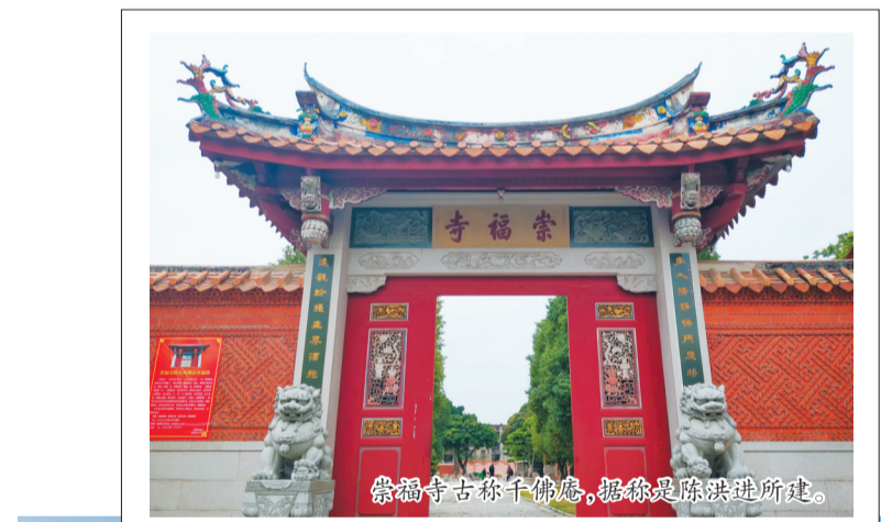
崇福寺古称千佛庵,据说是陈洪进所建

陈洪进归顺大宋,不仅使泉、漳地区免受战乱,维护了和平局面,还侧面推动了吴越国的随后归降,彻底结束五代十国的分裂局面,为国家统一做出了重要贡献。