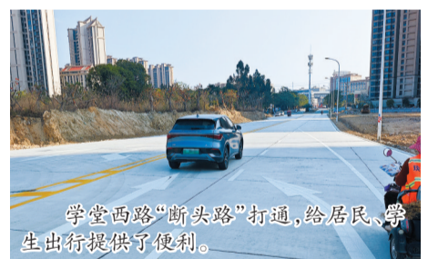
学堂西路“断头路”打通,给居民、学生出行提供了便利。

一条小路,折射治理精度;一次贯通,彰显为民初心。随着学堂西路断头路的启用,湖东片区“微循环”全面激活,城市路网更均衡、更安全、更有温度。下一步,台商区将持续聚焦群众“急难愁盼”,以更多“小切口”撬动“大民生”,加快构建便捷、绿色、韧性、智慧的城市交通体系。