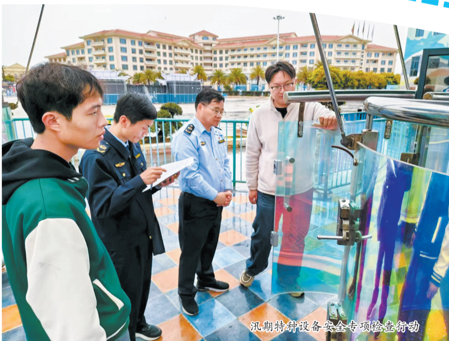
汛期特种设备安全专项检查行动

下一步,该局将持续关注汛期天气变化,保持监管高压态势,加大巡查频次,抓实隐患排查整治,全力保障辖区特种设备安全平稳运行,为群众安居乐业筑牢安全屏障。