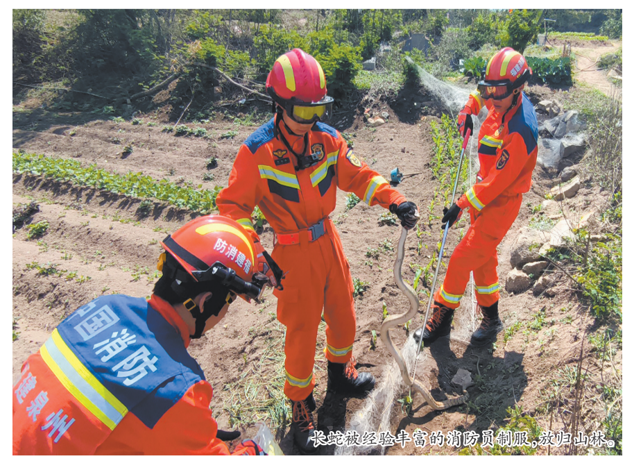
大蛇被经验丰富的消防员制服,放归山林。

消防部门温馨提示:春季气温回升,蛇类结束冬眠进入活跃期,频繁出没于田间地头、房前屋后。若市民发现蛇类,切勿自行捕捉、驱赶或用手触碰,以免被蛇咬伤。应立即远离并拨打110或119报警电话,等待专业人员到场处置,确保自身安全。同时,也呼吁大家共同保护野生动物,维护生态平衡。