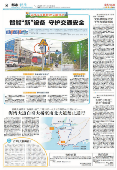
本报去年7月23日关注“鲲鹏智哨”