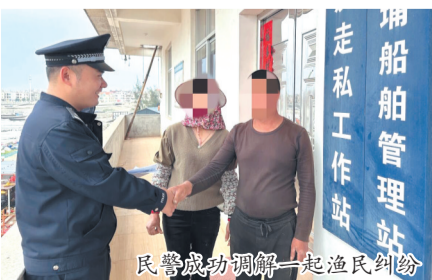
民警成功调解一起渔民纠纷

本报讯(融媒体记者张文璟 通讯员康玲 张希达 文/图)矛盾化解在基层,平安才能扎根在民心。日前,惠安县公安局东岭派出所将服务触角延伸至渔农产业一线,在渔业合作社设立“护渔调解室”。