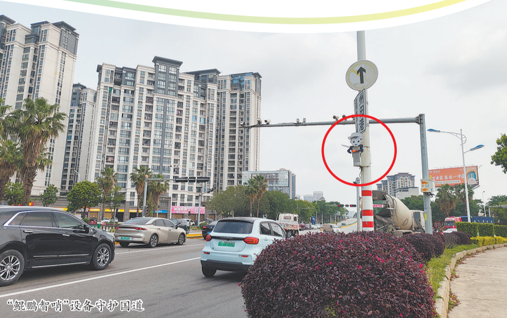
“鲲鹏智哨”设备守护国道