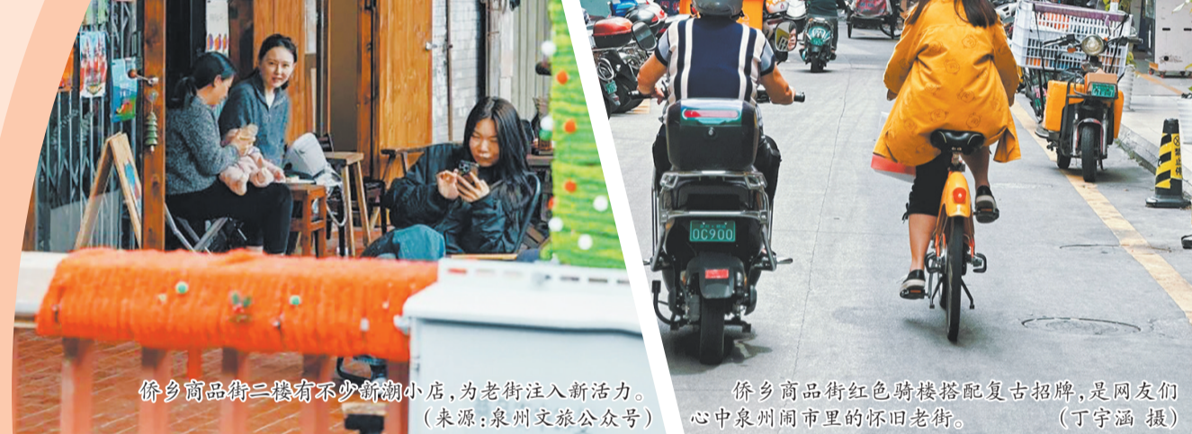
侨乡商品街二楼有不少新潮小店,为老街注入新活力。