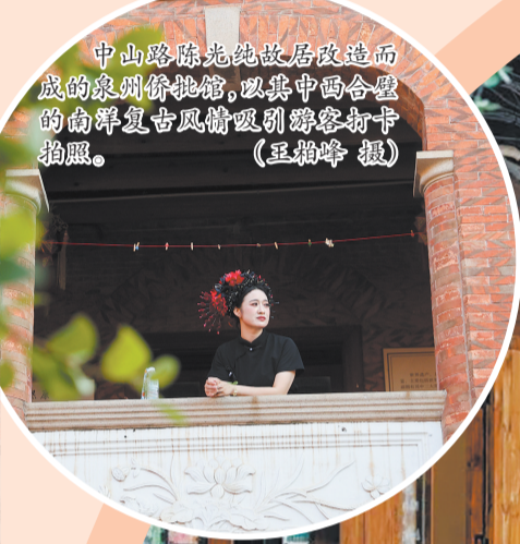
中山路陈光纯故居改造而成的泉州侨批馆,以其中西合璧的南洋复古风情吸引游客打卡拍照。