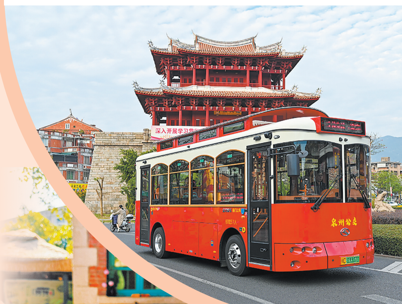
乘着复古风格铛铛车游古城(本报资料图)

除此之外,你还可以在古城老式钟表行里看看修表师傅的匠心巧手;在百年古厝茶馆里泡一壶老茶,配一份茶点;聆听、观赏一场历经岁月沉淀的婉转南音和提线木偶表演;在源和堂、水门国仔等老字号里,品味最地道的闽南古早味;伴着清脆的铃铛声响,开启一场穿行于泉州烟火中的复古之旅,感受那些从未远去的往昔美好。