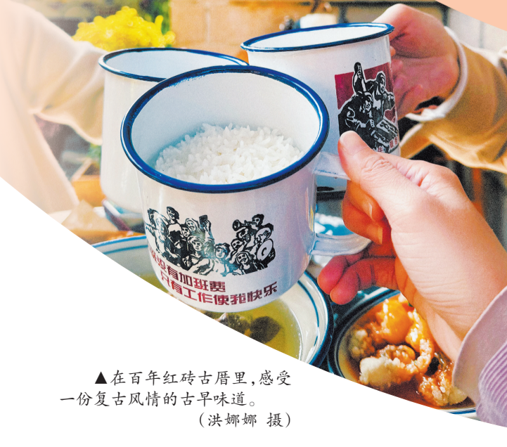
▲在百年红砖古厝里,感受一份复古风情的古早味道。