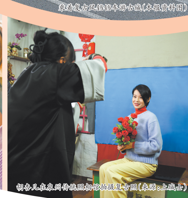
胡杏儿在泉州传统照相馆拍摄复古照