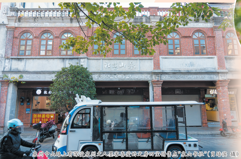
泉州中山路上有深受泉州文人墨客喜爱的文房四宝销售点“泉州书社”