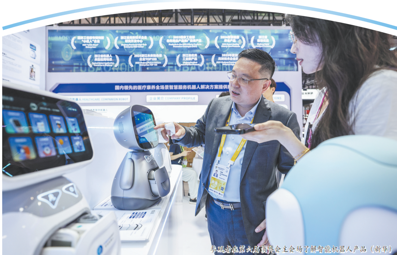
参观者在第六届消博会主会场了解智能机器人产品。(新华)

在今年的消博会上,将有超200个系列新品集中首发,40余个主体、近百个品牌参与发布,涵盖医药健康、珠宝首饰、数字科技等领域。(中新)