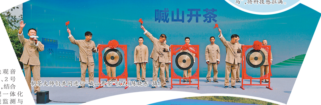
制茶大师们共同进行“喊山开茶”仪式

溪铁观音1号、2号卫星，结合水肥一体化智能监测与声光电物理防治技术，推动茶园科学化、精细化管理；在初制加工环节，落地5G智能加工工厂，实现鲜叶到毛茶全流程连续化、标准化、智能化生产，降本增效超50%；在精制加工环节，启用第六代乌龙茶智能加工生产线，实现加工全程自动化、清洁化、智能化，生产效率提升20倍、产品良率≥99.5%、能耗降低30%；在深加工领域，依托生物萃取技术开发即饮型茶饮饮料，打造茶膏、茶合片等功能性茶饮产品；在包装与物流环节，自主研发智能真空包装设备与AGV机器人自主分拣系统，日均处理订单超1.3万单，人工成本降低30%、分拣准确率高达99.99%；在市场销售环节，依托互联网数字技术，布局货柜电商、兴趣电商、直播电商、跨境电商等全渠道销售矩阵，通过全链路智能化运营、智能仓配、弹性物流协同，实现日均发货超30万单，茶叶电商销量占全国四分之一，产品远销全球各地。与此同时，依托中国乌龙茶产业研究院，联手中国农业科学院茶叶研究所、中国茶叶科学研究院、浙江大学、湖南农业大学、福建农林大学等顶尖科研院所，安溪开展产业关键核心技术攻关，推动一大批优质科研成果落地转化，为安溪茶产业持续领跑全国茶业提供了强有力的科技支撑。