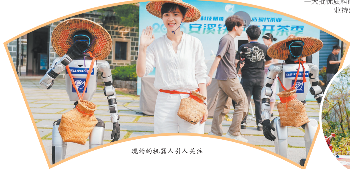
现场的机器人引人关注

综合安溪各茶叶主产乡镇、茶企、合作社及收购点的多方反馈，今年安溪春茶预计将呈现“品质提升、产量稳定、产销两旺”的良好态势。自3月底以来，安溪雨水充沛、气候适宜，茶树长势喜人，春茶产量基本盘稳固。随着“品牌兴茶”计划的深入实施，安溪铁观音的知名度与美誉度持续攀升，涵盖高端茶、大众茶、新式茶饮的多元产品体系不断完善，进一步拉动了消费回暖、产销两旺。