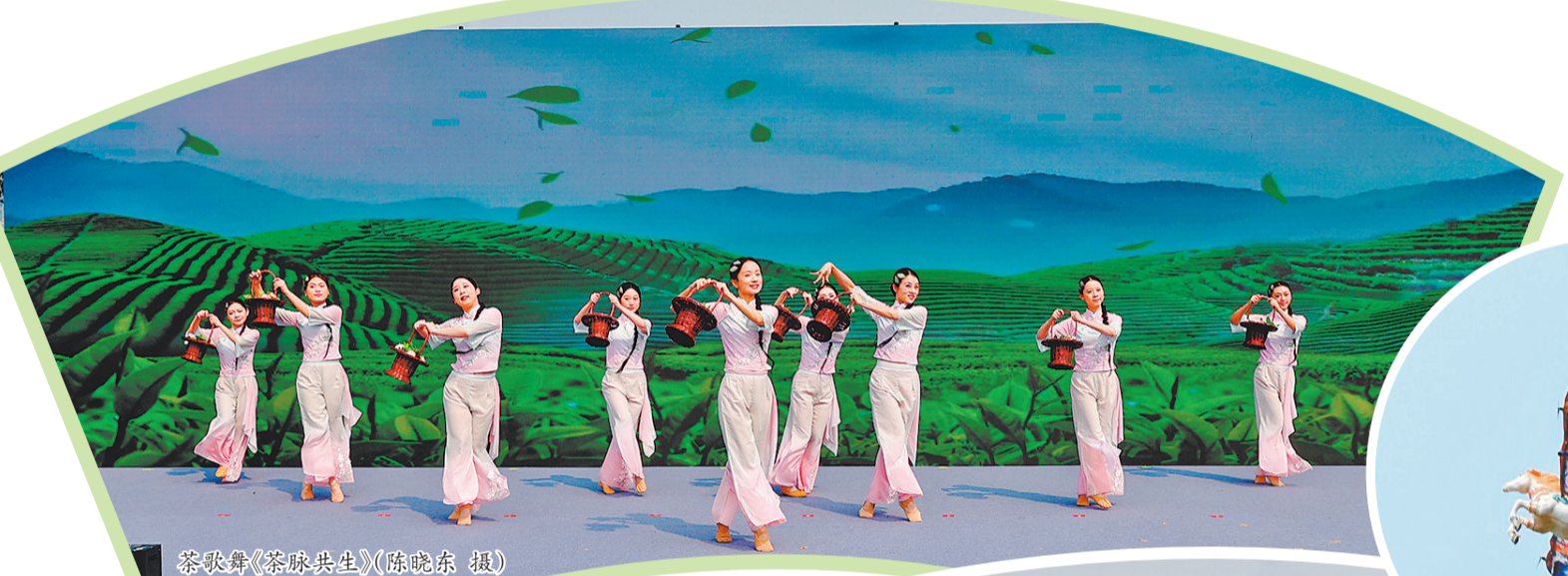
茶歌舞《茶味共生》

中国茶叶流通协会会长、全国茶叶标准化技术委员会主任委员王庆在祝贺视频中表示，希望安溪坚守茶业强县初心，以文化为根、科技为翼、产业为基，持续做大做强安溪铁观音“金字招牌”，深化全产业链提质增效，不断拓展国内国际两个市场，奋力打造现代茶业高质量发展的先行标杆。