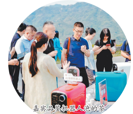
嘉宾品鉴机器人泡的茶

活动现场，全球重要农业文化遗产“安溪铁观音茶文化系统”首批10名村级守护人代表获颁证书，表彰其在茶山守护、技艺传承中的坚守与付出，进一步筑牢安溪茶业文化根基。近年来，安溪围绕种源保护、技艺传承、人才培养、标准修订等核心任务，持续深化安溪铁观音“双世遗”的保护传承与发展利用，让千年茶脉在新时代焕发新活力。