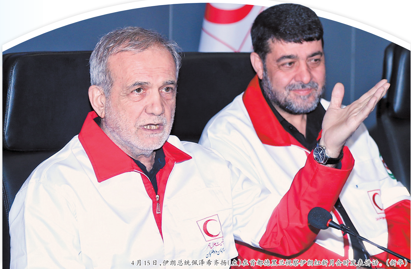
4月15日,伊朗总统佩泽希齐扬(左)在首都德黑兰视察伊朗新月会时发表讲话。

当地时间4月16日,美国国防部长赫格塞思在新闻发布会上说,美财政部正在启动代号为“经济狂怒”(Economic Fury)的行动,“对伊朗施加最大化的经济压力”。