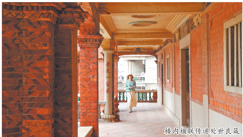
楼内楹联传递处世良箴

观海楼孕育了东店华侨的爱国爱乡情怀,也教会年轻一代懂得感恩,将这些乡贤永铭于心。如今的东店村,从电厂旧址到侨文化园,一路都是侨捐工程的印记:斑驳的水塔、崭新的教学楼、刻着姓名的功德碑。这些不是冰冷的石头,是侨胞们的赤子心,是“根”的具象化。暮色渐浓,观海楼的灯亮了,檐角的灯笼在风里轻响,仿佛在说:70多年来,楼还是那栋楼,家训还是那些家训,只是墙外的榕树更高了,楼里的子孙行得更远了——但无论走多远,只要看到、想到那些镌刻在楼上的五角星,就知道:虽身在海的一边,但根仍在东店。