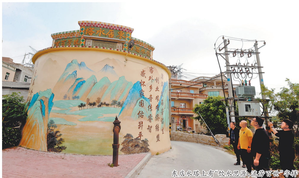
东店水塔上有“饮水思源,流芳百世”等联