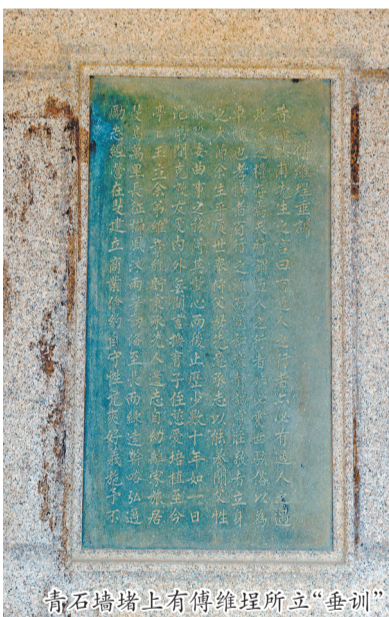
青石墙堵上有傅维理所立“垂训”