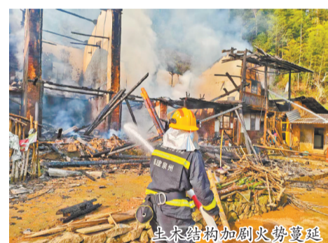
生米结构加剧火势蔓延

本报讯(融媒体记者陈明华 通讯员黄钰颖 郑伟仙 文/图)近日,德化县美湖镇一栋民房突发火灾,老化电气线路故障引燃可燃物,导致整栋房屋被烧毁坍塌,所幸未造成人员伤亡。