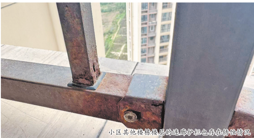
小区其他楼栋楼层的连廊护栏也存在锈蚀情况

4月15日上午10时30分许,记者来到水头镇,柯女士所住的小区共有9栋高层住宅,每栋均有30多层,每层左右两侧都设有开放式连廊。站在高楼层的连廊向外俯瞰,数十米的高空落差一目了然,而靠外一侧的连廊仅有一排约半人高的金属栏杆围档防护。在柯女士家门口,记者看到,之前发生断裂的连廊栏杆靠近其入户大门。物业已对断裂栏杆更换了全新部件,同楼层其余栏杆也完成了除锈刷漆作业,现场还张贴着“油漆未干 请勿触碰”的提示标识,纸上还印有“联发集团物业”的字样。不过,仔细观察仍会发现,栏杆表面凹凸不平、存在明显色差,个别栏杆用力就可以晃动。