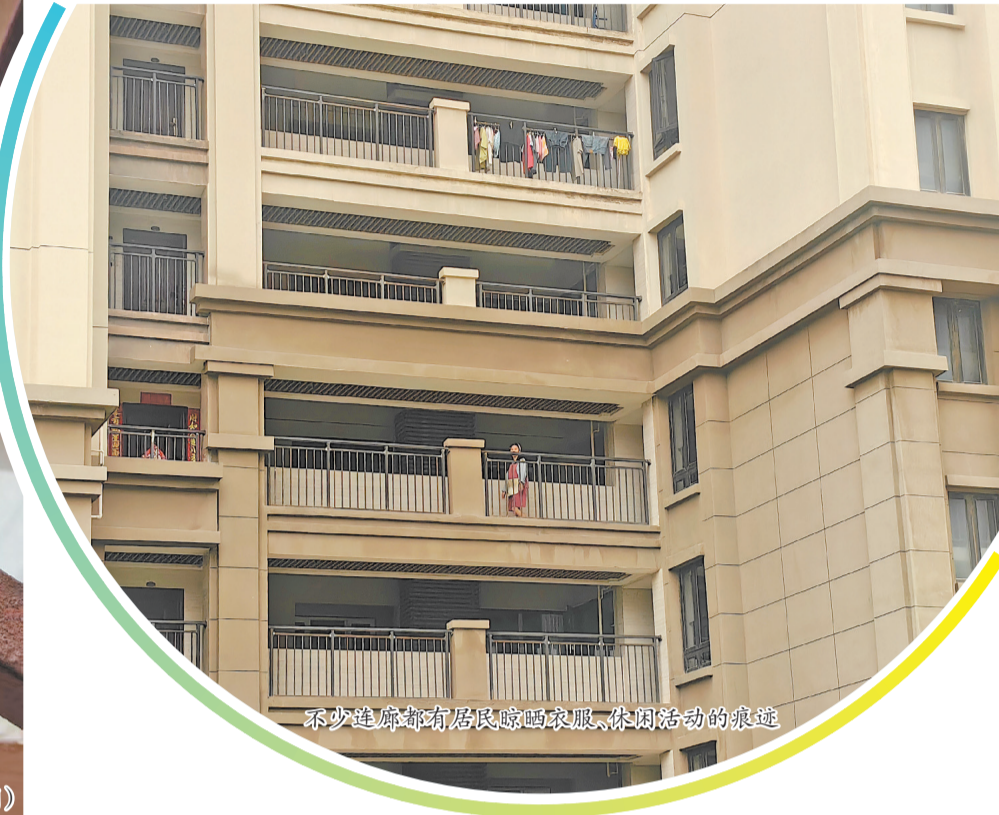
不少连廊都有居民晾晒衣服、休闲活动的痕迹