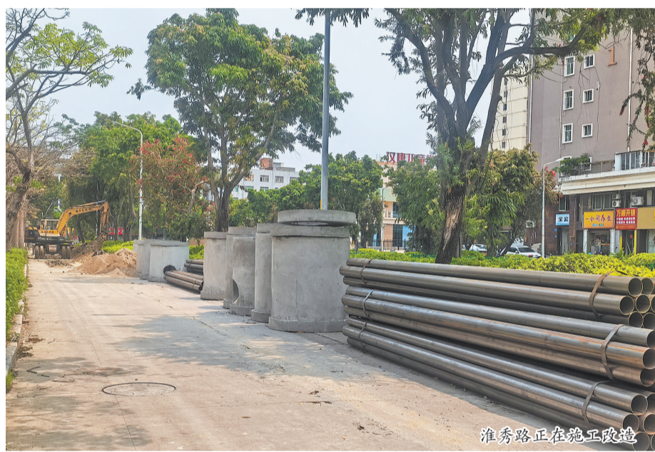
淮秀路正在施工改造

泉州网的“民声有约”栏目是一个旨在体现“网民有所呼 部门有所应”的网络沟通平台。我们将定期把网民关切的问题和职能部门的回应摘录推出,以期引起更多的关注、更多的参与,凝聚正能量,助推和谐社会的构建!