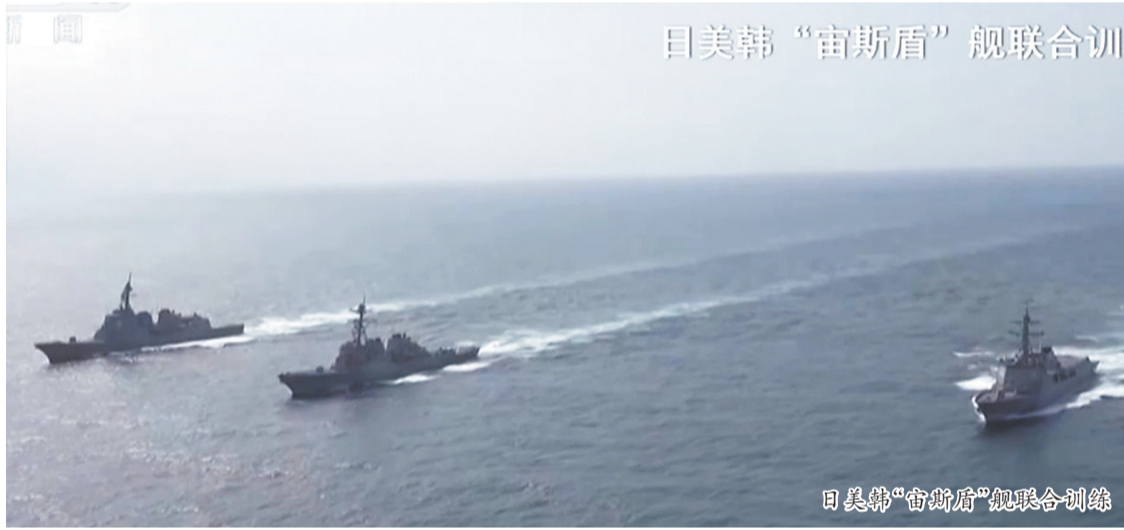
日美韩“宙斯盾”舰联合训练

美国白宫近日向国会提交了2027财年联邦预算提案,其中国防预算高达1.5万亿美元。该预算较2026财年大幅增加约4450亿美元,军费增幅约42%。若该提案获得国会通过,其增幅将成为二战结束以来美国年度军费增幅最大的一次。央视 军事