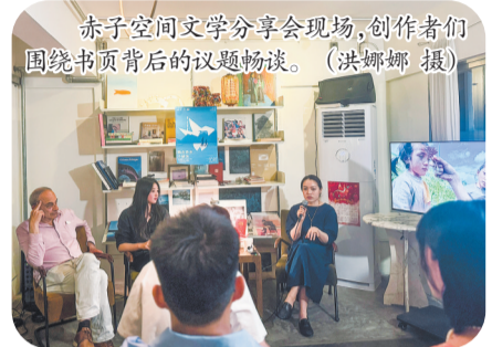
文学分享会现场,创作者们围绕书后议题畅谈。

23日“世界读书日”当天,我市将于东海工人文化宫大会堂举办“走进泉州·阅见山海”2026年泉州全民阅读大会,特邀白岩松、蔡崇达等到场分享有关阅读的思考。而连日来,为迎接今年的“全民阅读活动周”“世界读书日”,多项带着书卷气的阅读相关活动在泉州相继开展,书香弥漫于刺桐城的各个角落。