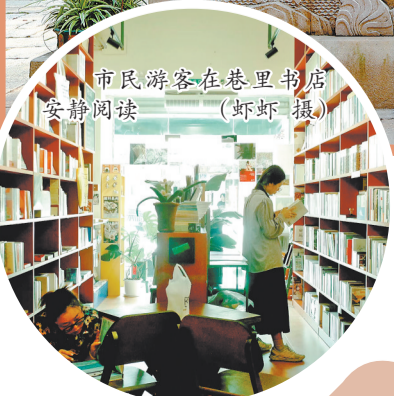
市民游客在巷里书店安静阅读