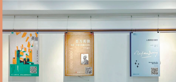
为迎接“全民阅读活动周”,丰泽区图书馆推出经典阅读推荐展。