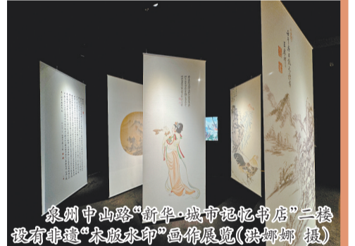
泉州中山路“新华·城市记忆书店”二楼设有非遗“宋版水印”画作展览