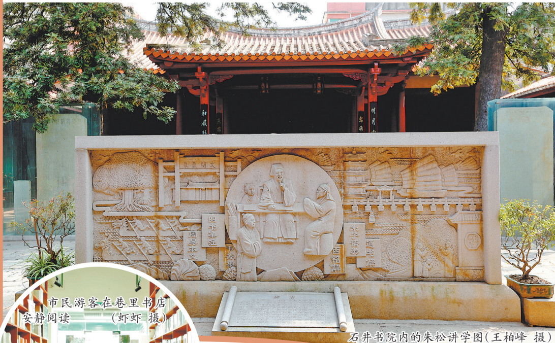
石井书院内的朱松讲学图