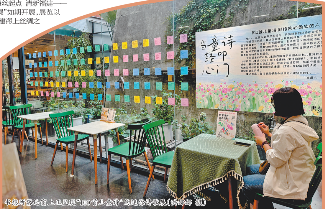
书想所落地窗上呈现“100首儿童诗”的迷你诗展