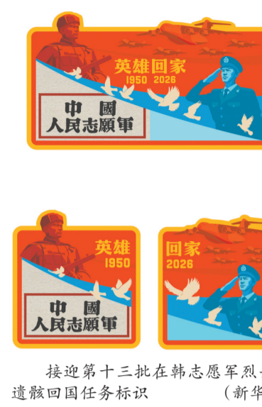
接迎第十三批在韩志愿军烈士遗骸回国任务标识