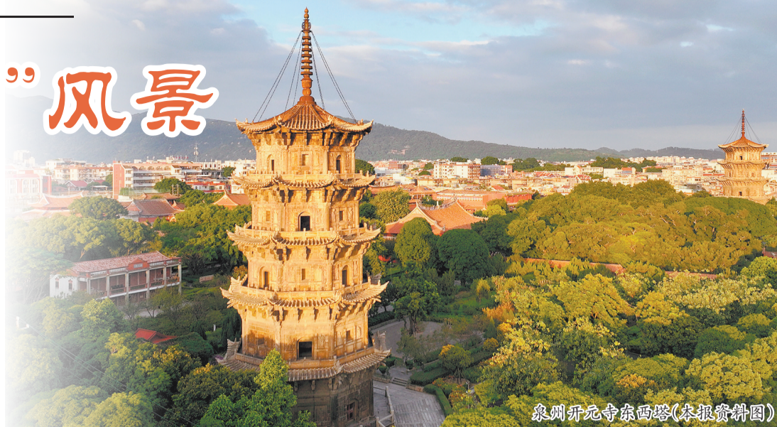
泉州开元寺东西塔(本报资料图)