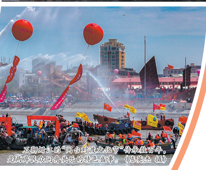
石狮蚶江的“闽台对渡文化节”传承数百年,是两岸民众同舟共乐的特色盛事。