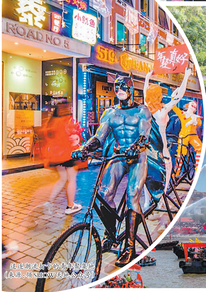
追逐潮流打卡的青年聚集地