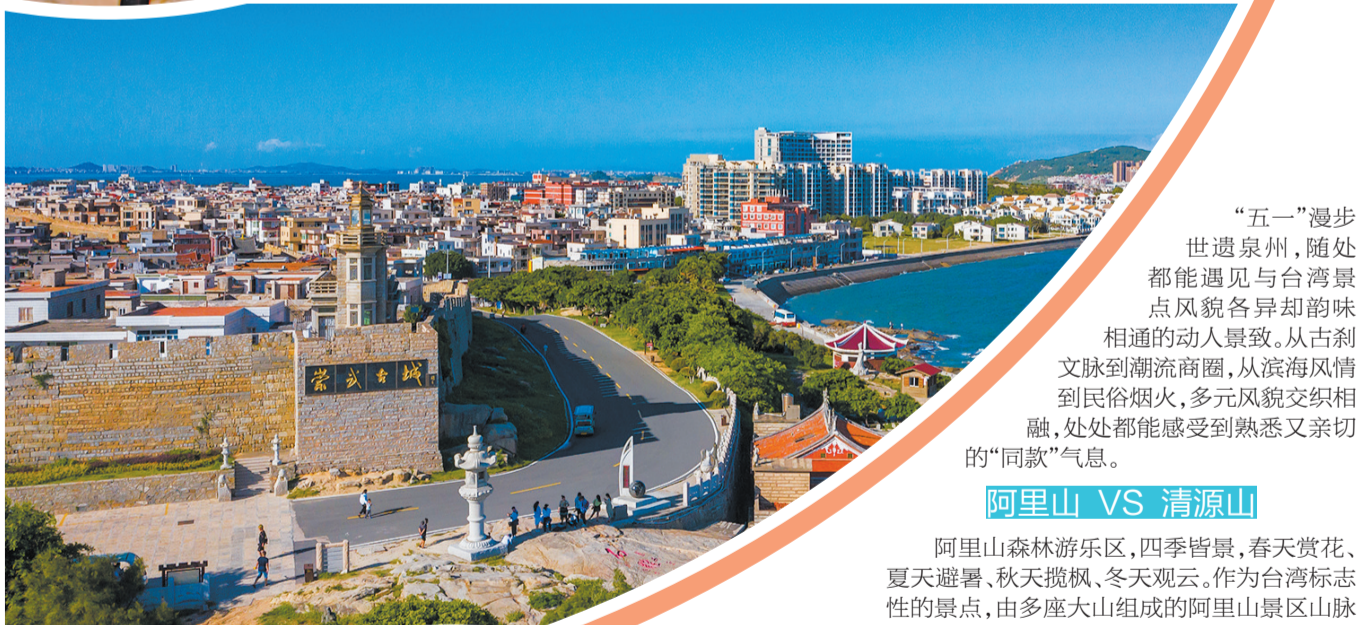
崇武古城风景区(本报资料图)