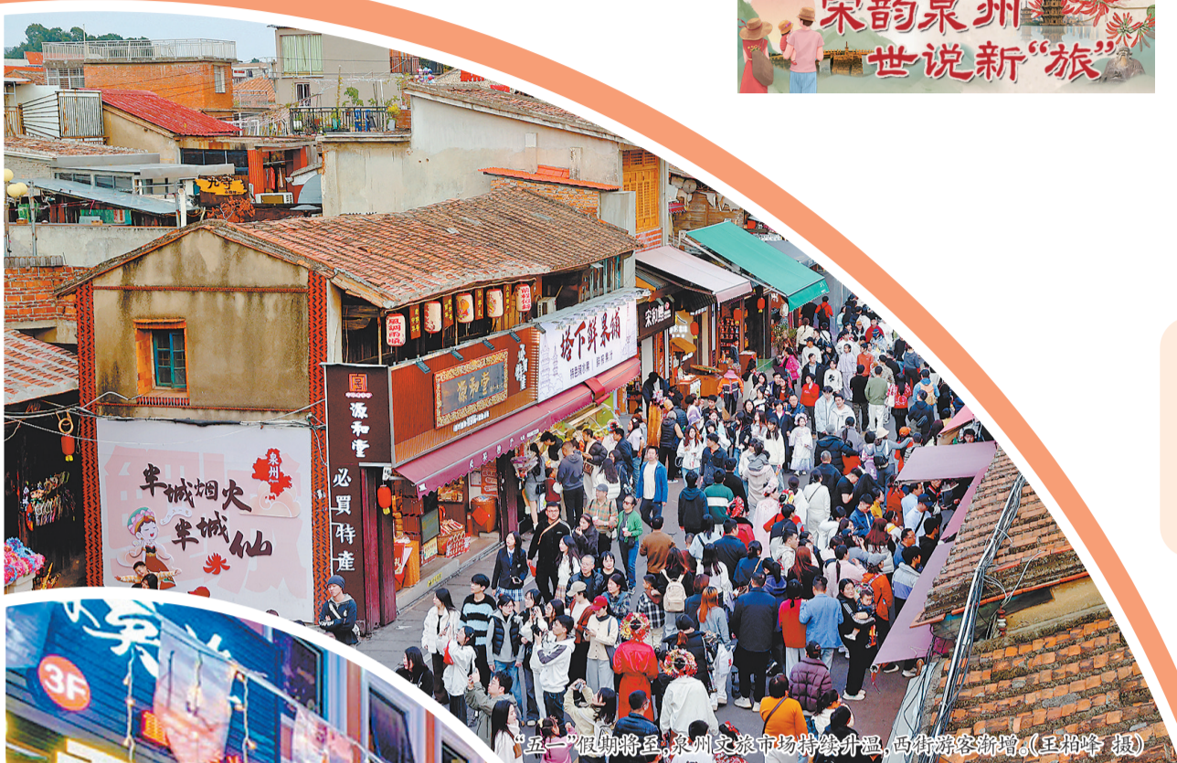
“五一”假期将至,泉州文旅市场持续升温,西街游客激增。