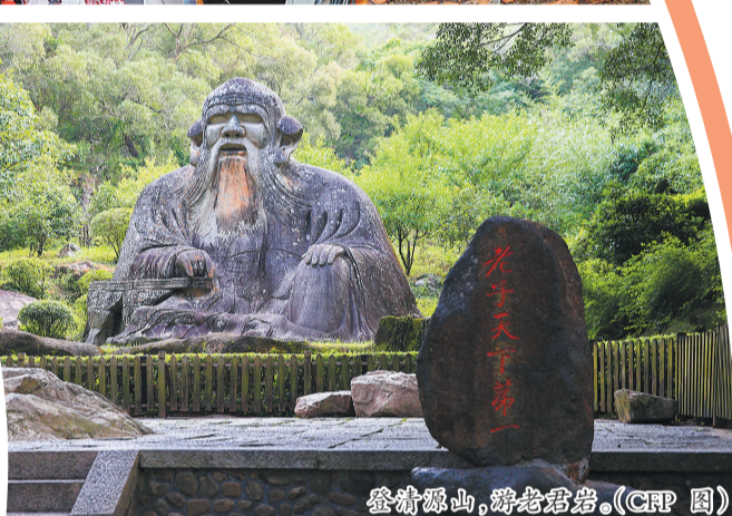
登清源山,游老君岩。