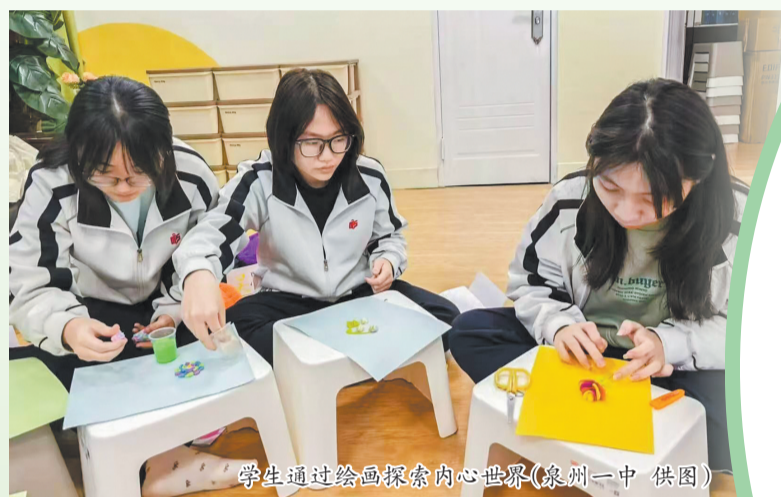
学生通过绘画探索内心世界

近日,由泉州市教育局主办的全市中小学校“温暖共生 心向未来”心理健康教育专题培训班正式开班,以深入践行教育部“健康第一”教育理念,全面强化师生心理健康保障能力。本次培训采取“线下集中参训+全程线上同步直播”形式,全市400余名班主任、专(兼)职心理教师现场参训学习,授课视频同步在泉教育平台“心理健康教育”专栏展播,助力全面筑牢校园心理健康防护网,构建全员、全程、全方位育人体系。 □融媒体记者 陈森森 通讯员 苏黄亮 文/图 (除署名外)