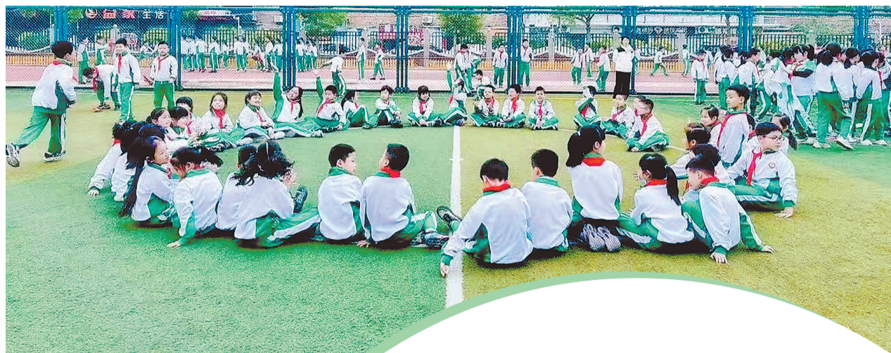
▲师生开展心理团建活动

下一步,泉州市教育局将以此次培训为契机,持续深化中小学校心理健康教育建设,健全师资培养培训机制,完善危机预警干预体系,推动心理健康教育与德育、学科教学深度融合,同步加强教师人文关怀与心理支持服务,打造温暖共生、积极向上的校园心理生态,为全市中小学生健康成长、全面发展保驾护航。