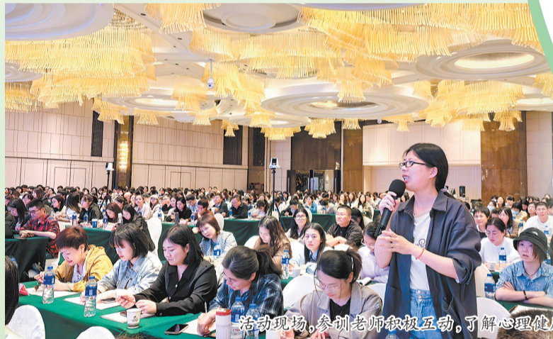
活动现场,参训老师积极互动,了解心理健康教育。