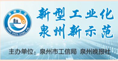
主办单位: 泉州市工信局 泉州晚报社

泉州入选首批国家制造业新型技术改造城市试点以来,按照“点线面”协同方式,全力推进新技改城市试点工作。2025年,泉州市工业投资增长14.8%,连续32个月实现两位数增长,技改投资增速22.1%,分别高于全省平均增速8.7个百分点、10个百分点,增速均位居全省第二位。全市93%的规模以上工业企业开展数字化转型。2024年,全社会研发投入达265.87亿元,增长11.2%,连续八年保持两位数增长,研发投入强度达2.03%,首次突破2%;投入工业企业有研发活动占比达47.6%,居全省首位。□融媒体记者 游怡冰 黄文珍 通讯员 谢坤霖