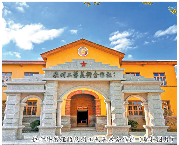
位于许厝埕的泉州工艺美术合作社(资料图)

从1954年的美术工厂到省级工业遗产,泉州市工艺美术工业公司大院正以遗产为媒,为古城高质量发展续写新篇章。