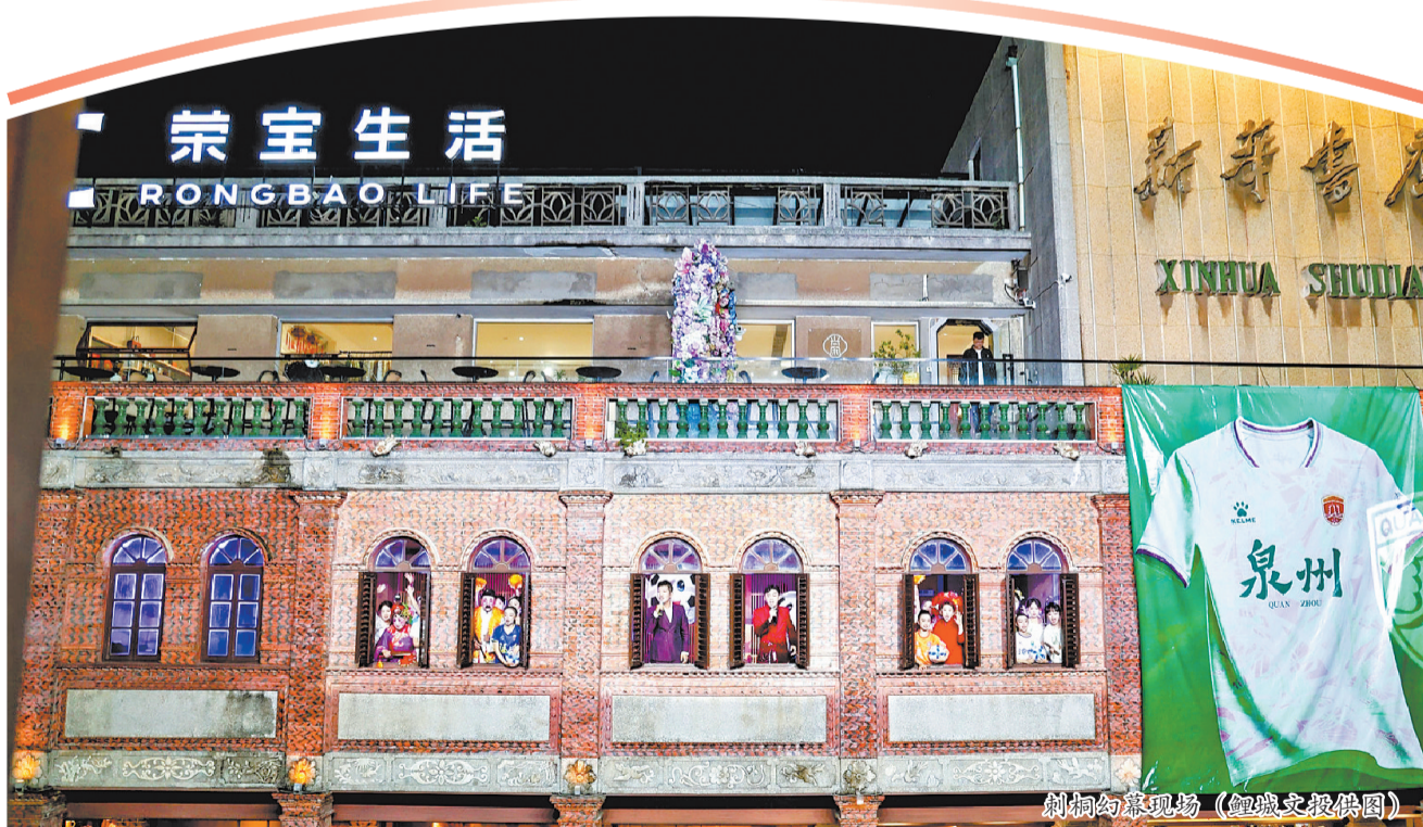
刺桐幻幕现场

以传统乐器奏出激昂旋律。情景舞蹈《非遗潮动闽超》将演出推向高潮——惠安女、蟳埔女、火鼎公婆、宋女与泉州队演员联袂登场，在动感现代音乐中传递足球，象征足球精神的传递与发扬。