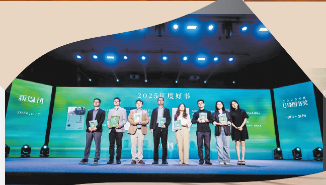
▲2025年度刀锋图书奖“年度好书”在泉州揭晓