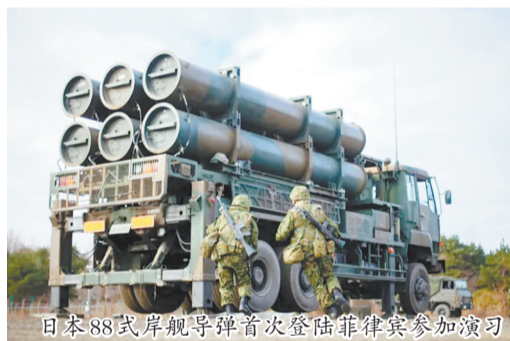
日本88式岸舰导弹首次登陆菲律宾参加演训

用指南,意味着日本将允许对外出口杀伤性武器。白孟宸告诉直新闻,日本此次派出菲律宾迫切需求的、兼具搜救、反潜、攻击的US-2水上飞机和88式岸舰导弹,都有明显的“推销”意味,将推高地区军备竞赛风险。