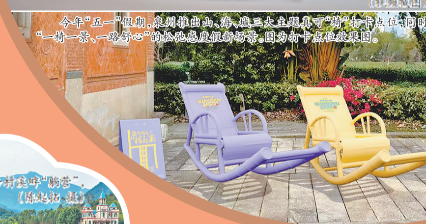
今年“五一”假期,泉州推出山、海、城三大主题真可‘椅’打卡点位,同时免费赠送超1万把专属便携折叠椅,打造“一椅一景,一路舒心”的松弛感度假新场景。图为打卡点位效果图。