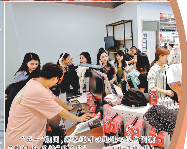
“五一”期间,游客还可以逛逛心仪的国潮品牌门店,尽情“买买买”。