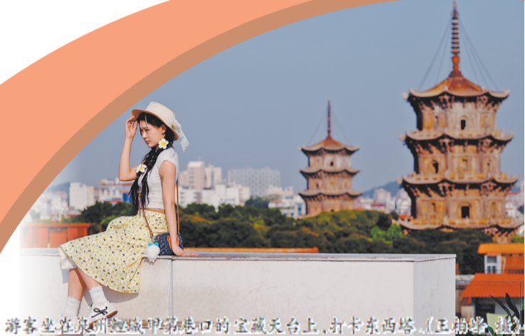
游客坐在泉州古城天台上,打卡东西塔。