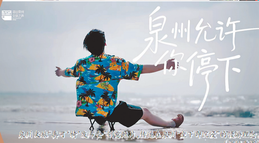
泉州文旅“真可‘椅’发布会”创意短片,传递在泉州“坐下即沉浸”的慢游理念。

——“五一”期间每日14:00至21:00,蟳埔渔人码头举办“跟着非遗去旅行——厝海‘有戏’非遗生活周”,以“偶遇一万种生活”为主题,融合提线木偶、掌中木偶、踩高跷、大鼓凉伞等非遗项目,把整个码头变成“没有边界的剧场”。你可以在市集摊位间支起折叠椅,面朝大海看一场南音演出。入夜后,落日舞台五天五场主题音乐演出连番登场,配懒人豆袋,伴着海风与星光,坐享浪漫视听盛宴。