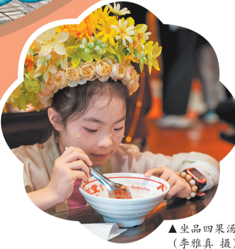
坐品四果汤