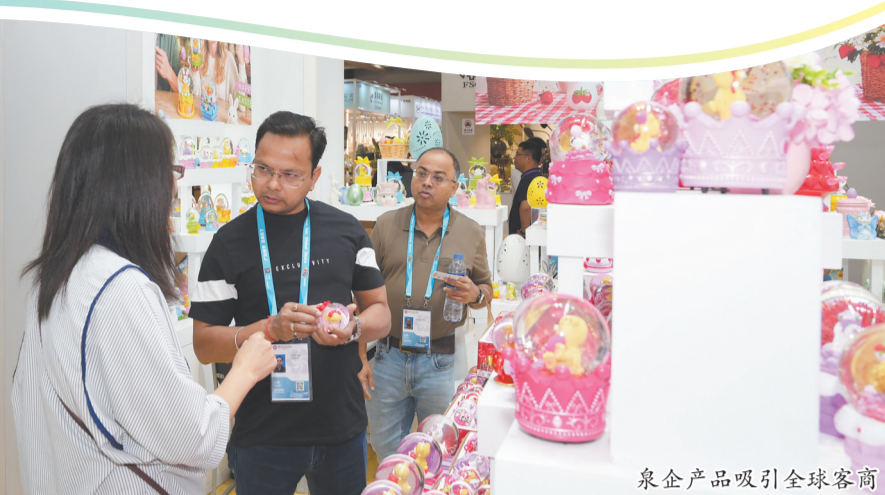
泉企产品吸引全球客商

4月27日,第139届广交会二期在广州圆满落幕,家居装饰、陶瓷礼品、园林用品、日用消费品等特色品类集中亮相。作为福建外贸主力军,泉州携超800个展位、全域优势产业企业参展,摒弃低价内卷、坚守品质底线、深耕创新设计,以全产业链优势亮相国际舞台,全方位展现泉州制造向高端化、品牌化、国际化转型的硬核实力,奏响外贸高质量发展奋进曲。□融媒体记者 王宇静 通讯员 何建富 张天峰 杨华文/图