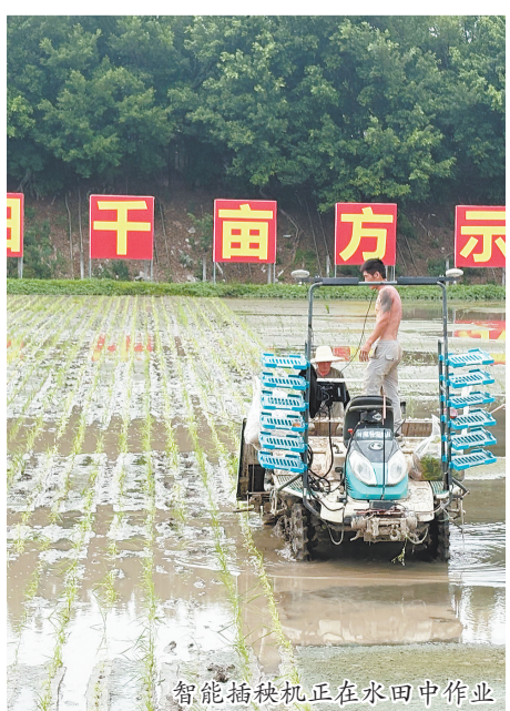
智能插秧机正在水田中作业

不止于田间作业,全市12个供销智创农庄实现全方位智慧管控,气象监测点、土壤墒情仪、自动化水肥一体机等物联网设备密布田间,采集的数据实时汇聚到农户手机App,精准提供灾害预警、农事指导,让灾害预警更精准、农事安排更科学。截至目前,全市供销系统累计实现农业社会化服务近10万亩。