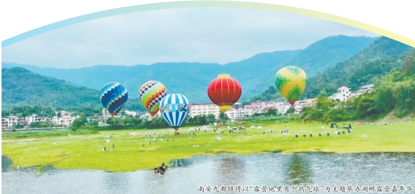
南安九都镇将以“露营地里有个热气球”为主题举办湖畔露营嘉年华

工业旅游方面,水头镇以英良石材自然历史博物馆、东星奢石文创园等为核心载体,打造“石艺之椅”网红打卡点与“工业探秘小课堂”。游客可近距离观赏珍稀石材、体验石雕工艺,从原石开采到文创设计、从家居智造到品牌展示,全方位感受“世界石都”的品质匠心,让“石尚”成为