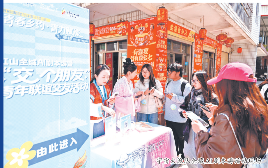
宇宙大派队全城AI剧本游活动现场