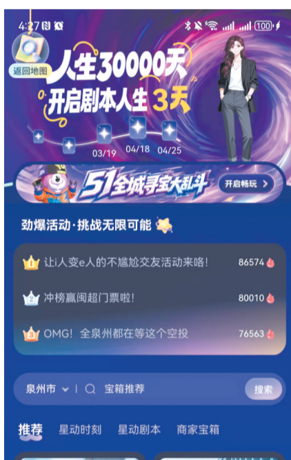
宇宙大派队App平台活动界面