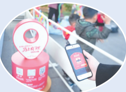
玩家用宇宙大派队App扫码开箱赢取福利

此外,Colorwalk城市微野、刺桐海丝图探寻、口是心非趣味挑战等多元剧本同步上线,覆盖文旅、运动、美食、社交等场景,满足不同群体需求。市民与游客可通过宇宙大派队App/微信小程序,或“泉州发布”小程序“AI剧本游泉州”入口、泉州通App专属频道、一部手机游泉州等平台一键参与,零门槛开启假期剧情。