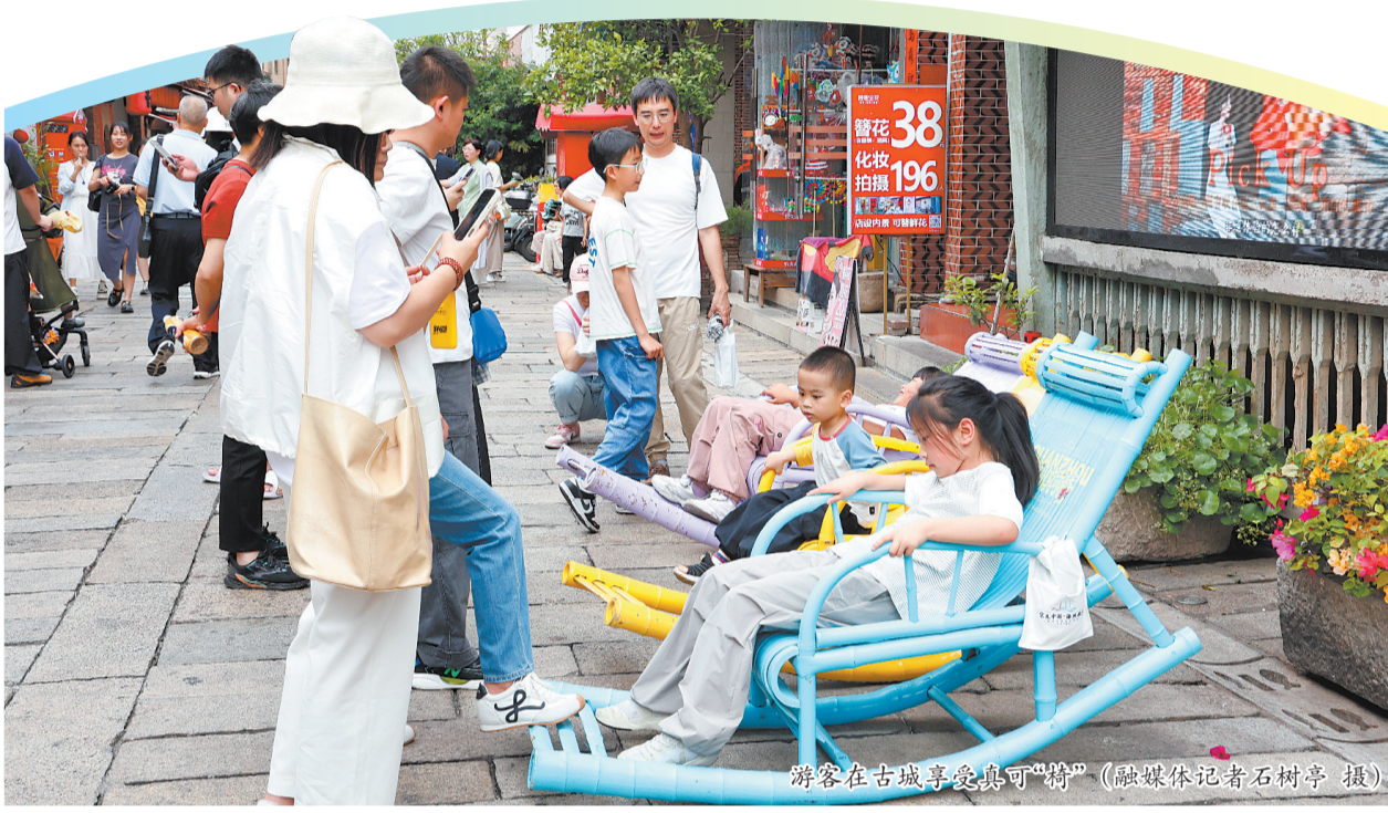
游客在古城享受真可“椅”

在丰泽，“厝角有戏”泉州蟳埔非遗生活周于5月1日—5日在丰泽蟳埔渔人码头开幕，以“偶”遇1万种生活为主题，将世界级非遗、滨海风光与潮流生活融合，打造“枕海听风到蟳埔”文旅消费新场景和可看、可玩、可拍、可体验的城市文旅新名片，专为市民与游客定制一场海边戏剧盛宴。活动以掌中木偶、提线木偶、南音、拍胸舞、火鼎公婆等非遗为核心，创新“无边界剧场”模式。戏剧巡游打破固定舞台限制，提线木偶、掌中木偶、踩高跷、大鼓凉伞等10余项非遗表演深入人群，与观众零距离互动，随处可见“偶遇式”惊喜演出，随手一拍就是朋友圈爆款。落日舞台以“海边声场”为亮点，5天分别呈现70、80、90、00年代的经典老歌，以及闽南语歌曲专场，搭配