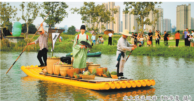
水上花漾巡游

活动期间推出“水上花漾巡游”，风物船与花船穿行九十九溪河道，再现宋元水上市集风情。游客可体验充气皮划艇、水上自行车等亲水项目，也可在滨水露营区放松休闲。田园漫游方面，两条骑行路线串联城市与郊野，观光车穿梭万亩田野，方便游客慢享田园风光。