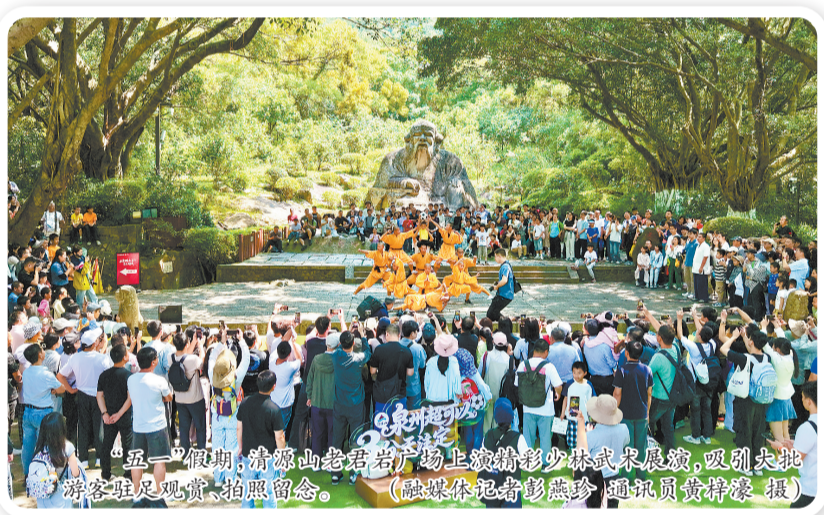
“五一”假期，清源山老君岩广场上演精彩少林武术展演，吸引大批游客驻足观赏、拍照留念。

在南安，世遗九日山·祈风续海丝活动举行，还原宋元祈风仪式表演“九日山祈风仪式”，设置祈风石刻“世遗之椅”主题打卡点，开展循风探迹石刻集章打卡抽奖，举办小学生书法现场决赛，安排萌娃志愿者公益讲解世遗知识，设置遗产保护主题图片展，并打造祈风主题古风打卡场景，以多元形式活化世遗文化，为游客带来兼具历史底蕴与互动趣味的文旅体验。“特地过来看九日山的祈风仪式，除了感受传统文化仪式的魅力，还品尝了很多南安美食，体验感拉满了。”来自江西的周小姐说，九日山不仅仅是一个看风景的景区，还融合了很多