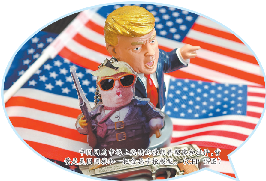
中国网购市场上热销的特朗普塑像和挂件,背景是美国国旗和一把金属手枪模型。

事实上,这揭示了更具普遍性的规律,即全球化供应链以企业成本和效率最优化的选择为基础形成。用行政手段强行切断,只会损失效率、推高成本。