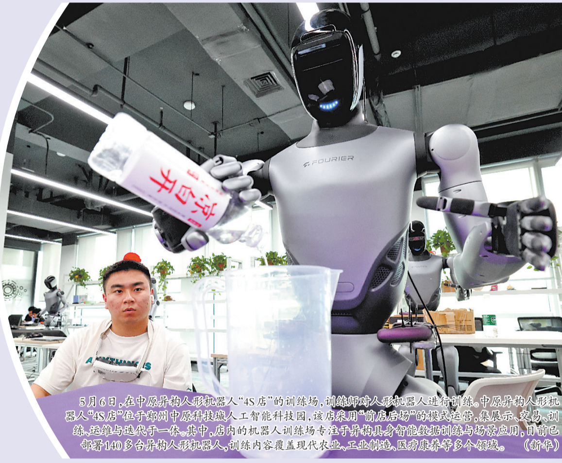
5月6日,在中原莱柯人形机器人“4S店”的训练场,训练师对人形机器人进行训练。中原莱柯人形机器人“4S店”位于郑州中原科技城人工智能科技园,该店采用“前店后场”的模式运营,集展示、交易、训练、运维与迭代于一体。其中,店内的机器人训练场专注于异构具身智能数据训练与场景应用,目前部署140多台异构人形机器人,训练内容覆盖现代农业、工业制造、医养康养等多个领域。