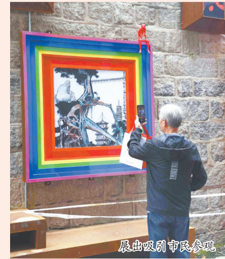
展出吸引市民参观