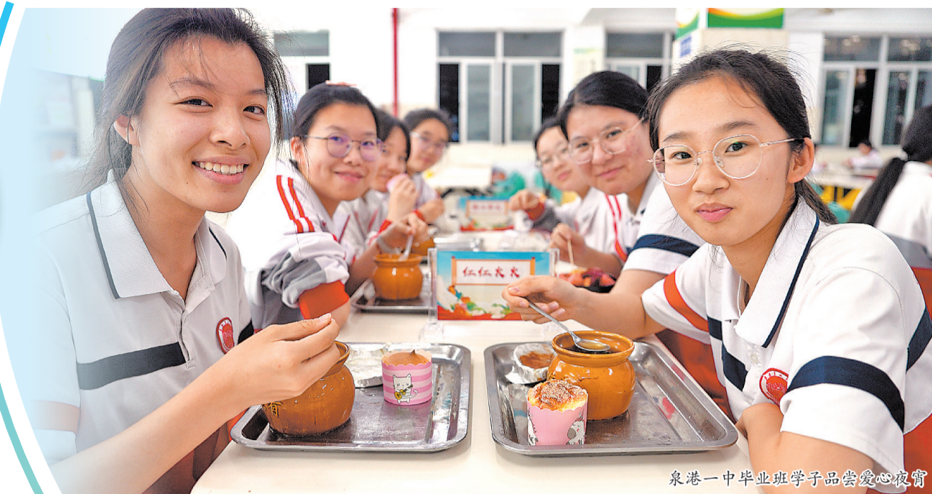
泉港一中毕业班学子品尝爱心夜宵

中高考临近,社会各界暖心护考举措持续“升温”。从免费爱心夜宵到清凉茶饮,从校内的精心筹备到校外的默默守护,全社会正汇聚起点滴关爱,为冲刺中高考的学子提供坚实的后勤保障,助力他们圆梦今夏。 □融媒体记者 张雯/文