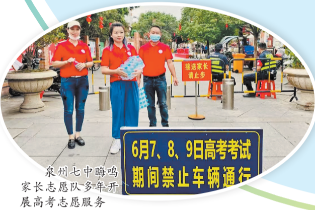
泉州七中中海鸣家长志愿队多年开展高考志愿服务

近年来,每逢高考前夕,泉州不少中学都会准备免费夜宵,让毕业生在紧张学习中及时补充能量。从2022年起,晋江市养正中学在高考前一个月开始为学生准备“高三限定夜宵”,今年该校的“深夜食堂”已于5月11日晚开张,菜品每日翻新、一周不重样。5月6日晚,晋江市毓英中学的“30天爱心夜宵计划”再次上线,第一顿爱心夜宵是营养美味的虫草花老鸭汤配香包,如期而至的还有一张张写有鼓励话语的“高考激励卡”。