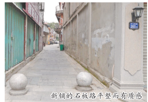
新铺的石板路平整而有质感

本报讯(融媒体记者杜婉琼 通讯员林思敏 文/图)日前,位于鲤城区临江街道的民生巷完成街巷修缮提升工程。这条不足百米的巷子在修旧如旧中重焕光彩,在守护历史记忆的同时,续写着古城的日常烟火。