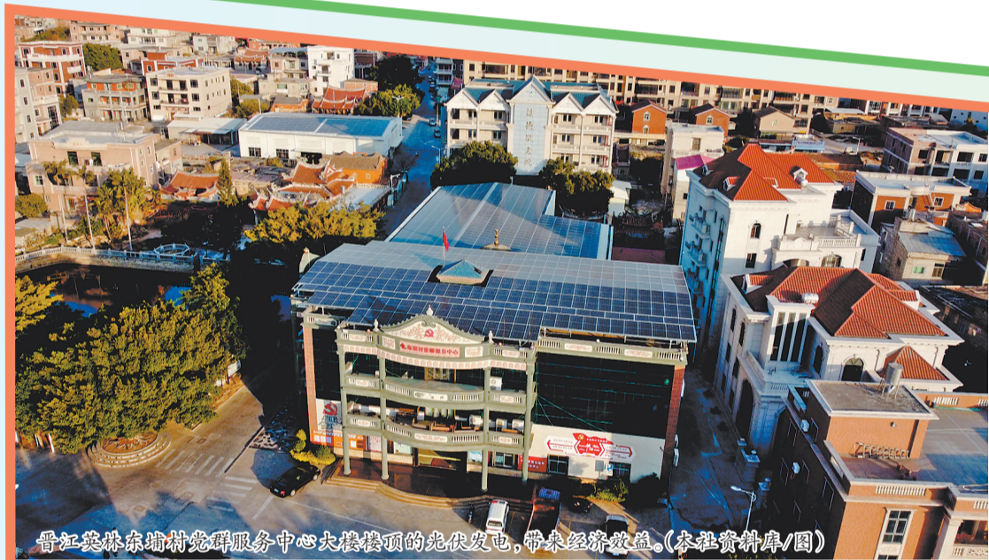
晋江英洛东埔村党群服务中心大楼楼顶的光伏发电,带来经济效益。