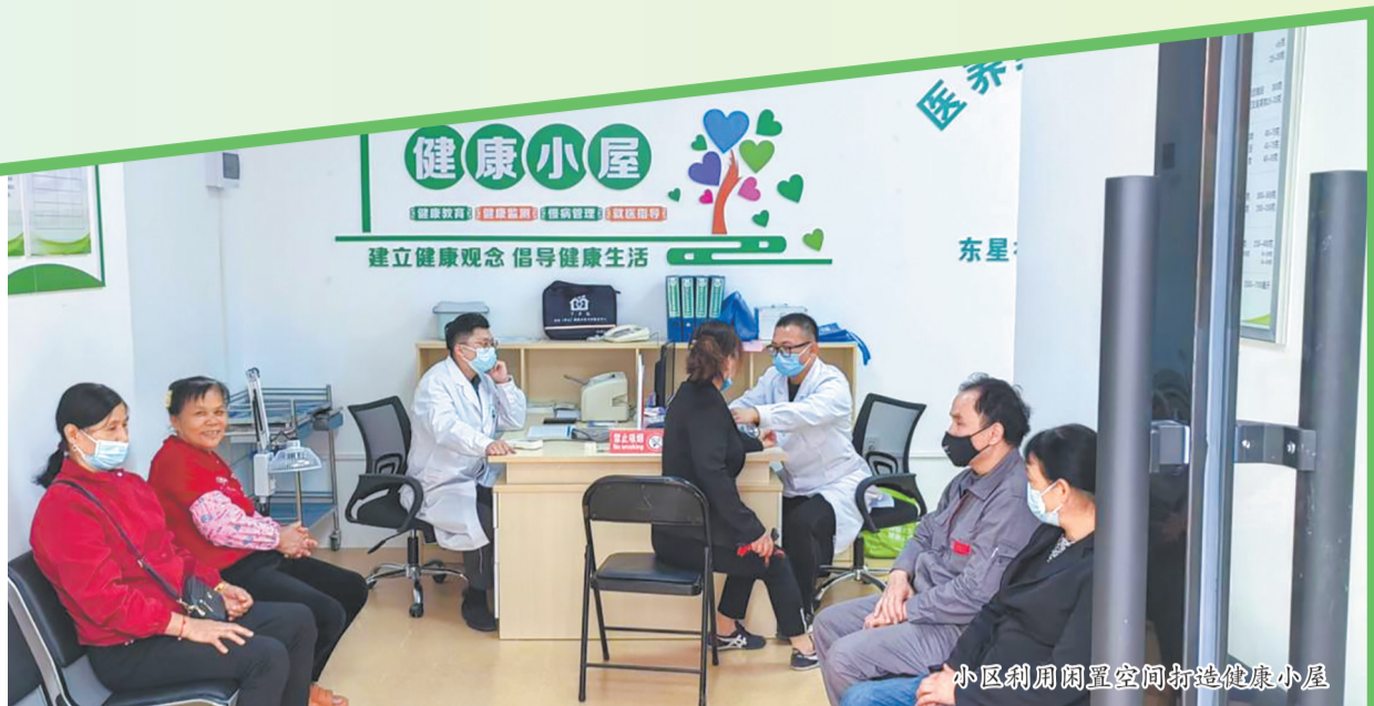
小区利用闲置空间打造健康小屋

闲置空间的活化更新,受益群体不仅仅是常住居民,更扩展到了每日穿梭于城市的新就业群体。晋江市青阳街道永福里社区第二网格将原本利用率不高的快递柜闲置区域升级改造,打造出面积约11平方米的“暖心空间”。在这块不大的地方,休息座位、饮水机和充电插座一应俱全,让外卖小哥累了能歇脚、渴了能喝水、手机能充电。社区工会联合网格每月开展设施检修,外卖骑手自发组成志愿清洁队,驿站虽小,守护却细致。洛江区则整合盘活闲置空间,共建“三区联享空间”、“暖”新驿站等服务阵地,配套打造“邻里暖心坊”、“心Fang工作室”等专属功能区,并为快递员、外卖小哥提供专属食堂、就业服务和生活便利。