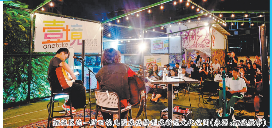
鲤城区的一所旧幼儿园成功转型成新型文化空间

与此同时,泉州持续深化各类专项行动,推出基层治理创新举措,多点发力推进存量空间和闲置空间盘活利用。通过深入开展物业管理提升三年行动,对全市小区公共资源进行“大起底”,建立可盘活公共资源台账等,增加小区公共收益,降低居民负担。安溪在全县140个小区全面铺开“清产核资”工作,为小区的公共资源、资产和资金精准“摸家底”,建立起翔实的资产台账。同时,引入第三方审计机构逐小区核查,采用线上问卷征集与线下座谈相结合的方式精准把握居民诉求,确保清产核资工作既符合政策规范,又贴近小区实际。石狮市首创“国企+村居”协作模式,聚焦安置小区闲置地下空间整治提升,通过专业化运维、功能化改造,有效破解安置小区车库管理混乱、空间闲置浪费等问题,在优化小区居住环境的同时,盘活了国有资产。随着一项项政策落地、一个个项目见效,城市空间利用率持续提升,人居环境不断优化,群众的获得感、幸福感、安全感也不断增强。