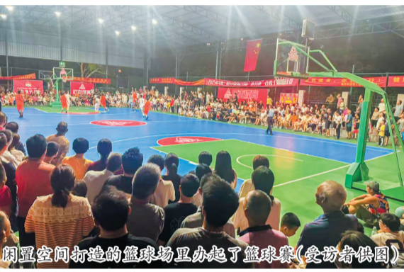
闲置空间打造的篮球场里办起了篮球赛