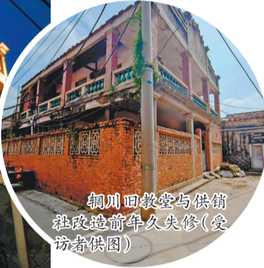
鲤城回教堂与供销社改造前年久失修