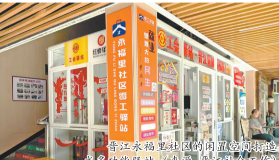
晋江永福里社区的闲置空间打造成多功能驿站