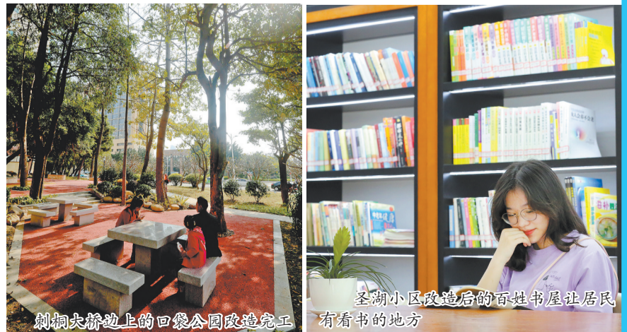
圣湖小区改造后的百姓书屋让居民有看书的地方