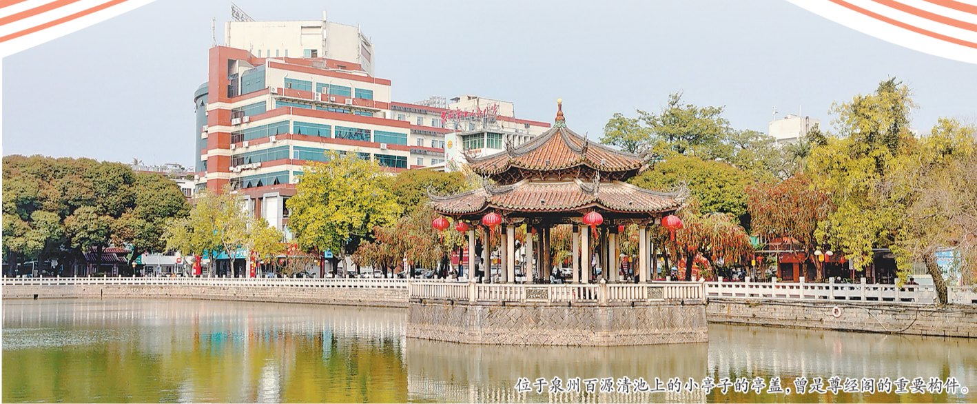
位于泉州百源清池上的小亭子的亭盖,曾是尊经阁的重要构件。