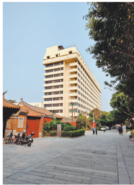
今泉州华侨大厦所处位置曾是尊经阁旧址

另外,当有上级来泉时,熊汝达又常为民请命,“公切切以时艰民贫为请,语不阿奉而意寓箴规”;也为受污的下属力证清白,“属官有被诬者,锐于解数;以飞语被污者弗能自者,力为白之。”