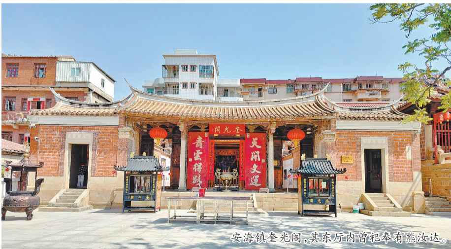
安海镇奎光阁,其东厅内曾祀奉有熊汝达。

诗中,林希元借用几位名宦典故衬托熊汝达的贤政。在泉州地区接二连三的遭受倭寇侵袭,且面对百姓流离失所,生活穷困之际,熊汝达作为泉州知府挺身而出,击退倭寇,平息倭乱。又不断推行仁政,减轻战乱带来的负面影响,从而让泉州百姓得到了喘息之机。