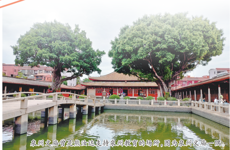
泉州文庙曾是熊汝达支持泉州教育的场所,因为泉州文庙一隅。