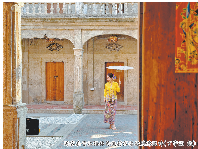
游客在晋江梧林传统村落体验娘惹服饰