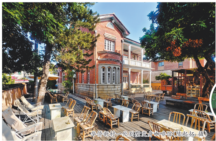
华侨新村一处别墅变身咖啡馆