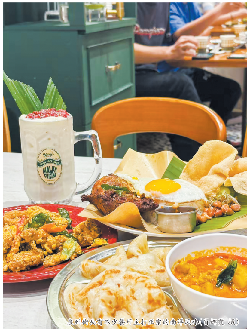
泉州街头有不少餐厅主打正宗的南洋风味

泉州城区内还散落着众多南洋风情建筑。古城中山路骑楼长廊绵延两公里多,“五脚基”设计既遮阳避雨又连通烟火,灰色水刷石与闽南红砖碰撞出独特美感;华侨新村是中国首个归侨别墅区,一幅幢幢红砖别墅呈井字形整齐排布,门牌以“几排几号”简洁标注,如今咖啡馆、私房菜、民宿等在此聚集,焕发新生。此外,还有镇抚巷叶氏洋楼、模范巷蔡水影洋楼、新步路的“飞机楼”、吴家厝民居等侨味建筑,也正等待游客前去探访。