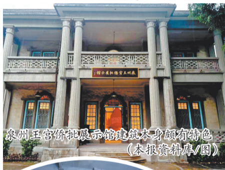
泉州王宫侨批展示馆建筑本身颇有特色(本报资料库/图)