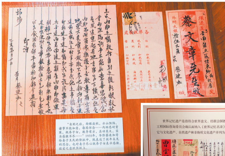
鲤城侨批分馆内,华侨寄给妻子的侨批。