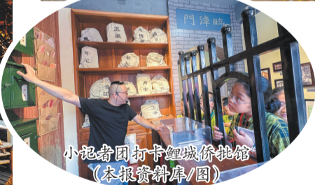
小沁奇团打卡鲤城侨批馆

在泉州,满载纸短情长的侨批馆,其建筑本体与所在街区,皆是南洋文化与闽南文化交融的活态载体。“下南洋”的侨胞们将南洋建筑美学带回故乡,融合本土工艺与家国情怀,打造出独具特色的侨乡建筑。漫步其间,既能品读侨批的温度,更能触摸百年侨史的肌理,感受真实可感的侨乡生活印记。