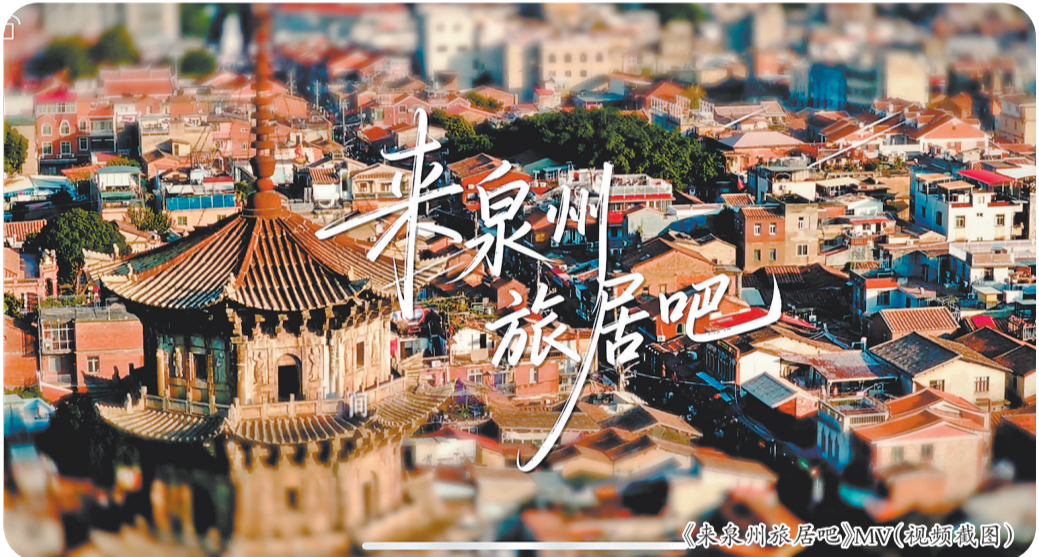
《来泉州旅居吧》MV(视频截图)

恰如《来泉州旅居吧》MV在歌词中反复唱道:“不是旅游,是给心里安个暖暖的家。”泉州希望发出的,正是这样一份邀请:先来住一段时间,用心感受,然后再决定要不要留下来。(来源:鲤城微事 整理:洪娜娜)