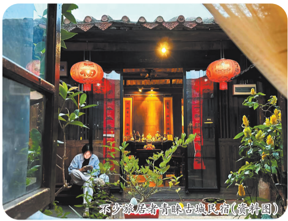
不少旅居者青睐古城民宿(资料图)

近年来,泉州文旅持续火爆,天南海北的游客纷至沓来,“旅居泉州”成为热门话题。近日,由鲤城区委宣传部制作的《来泉州旅居吧》原创音乐MV正式上线,词曲之间传递的不仅是对这座城市的向往,更是一份面向全国“旅居邀请函”。 如今,越来越多的人踏足泉州,不少人更是从“游客”变为“常客”,再到“住客”。泉州究竟有何种魅力,能让人们愿意停下匆匆脚步,甚至将生活扎根于此?近日,记者走访了多位旅居泉州古城的新朋友,聆听他们的“泉漂”故事,探寻这座古城独特的“留人密码”。