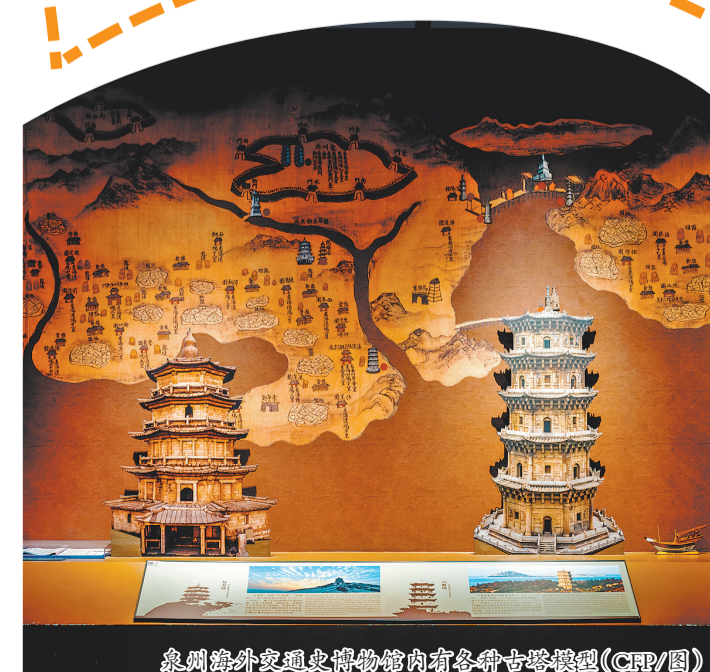
泉州海外交通史博物馆内有各种古塔模型