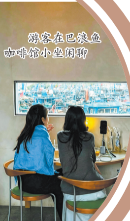
游客在巴浪鱼咖啡馆小坐闲聊