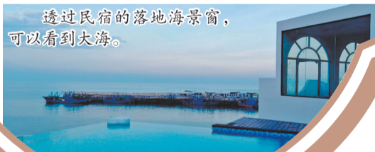
透过民宿的落地海景窗，可以看到大海。