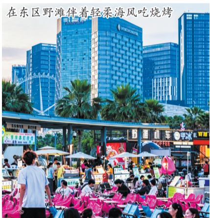
在东区野滩伴着轻柔海风吃烧烤