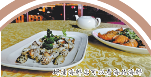
埭埔海鲜店可以赏海品海鲜

这里的美食，动人的灵魂是自然。所有食材均取自埭埔本地渔港，当日捕捞、当日上桌，从渔船到餐桌，不过数小时，最大程度保留着海洋的鲜甜本味。招牌的清蒸石斑鱼、白灼虾、姜母鸭焖海鲜、油炸蚵丸、蒜蓉粉丝蒸扇贝，每一道都是地道的闽南风味，食材新鲜、做法质朴，让食客在品尝鲜醇海味的同时，读懂泉州人“靠海吃海”的饮食智慧。