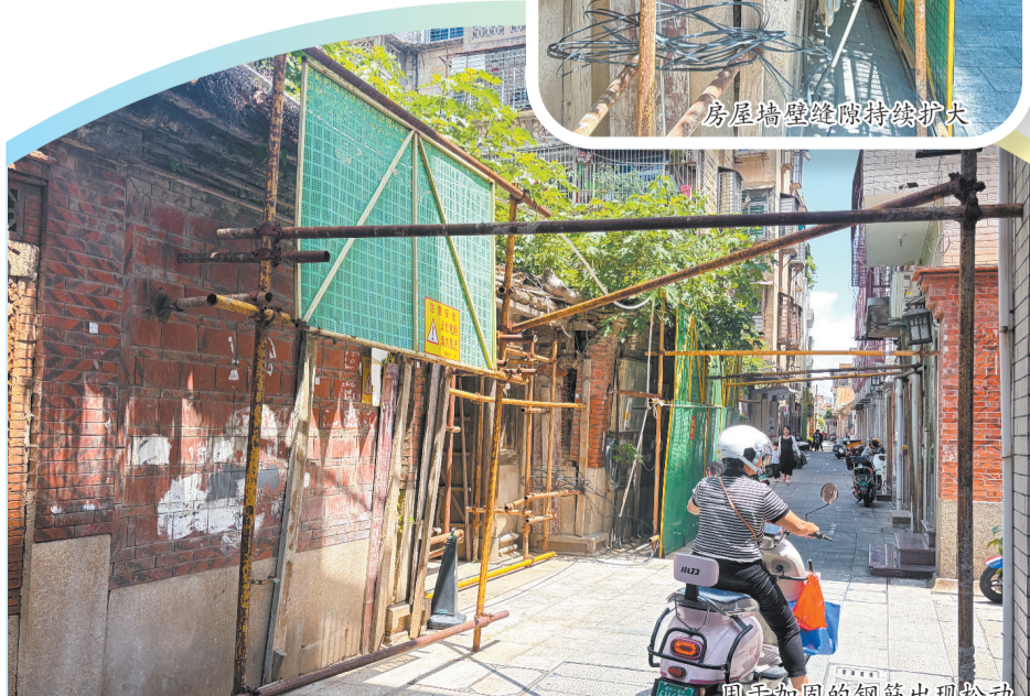
加固的钢筋出现松动