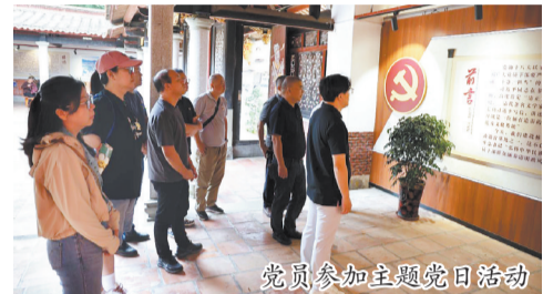
党员参加主题党日活动

活动中,党员们先后参观林嗣环廉政文化教育基地、安南永德苏维埃政府旧址及莫耶故居,接受思想洗礼与精神淬炼。在林嗣环廉政文化教育基地,党员们通过史料、展陈和讲解,深入了解林嗣环为官之道与品格,感悟廉洁自律、勤政为民的核心价值,筑牢思想防线,增强纪律、规矩意识和廉洁从政自觉性。在安南永德苏维埃政府旧址,党员们重温峥嵘岁月,缅怀先辈功绩,汲取奋进力量,激发传承红色基因的责任感与使命感。在莫耶故居,党员们深入了解莫耶的生平事迹与家国情怀,接受爱国主义教育的熏陶,进一步坚定了听党话、跟党走的信念。