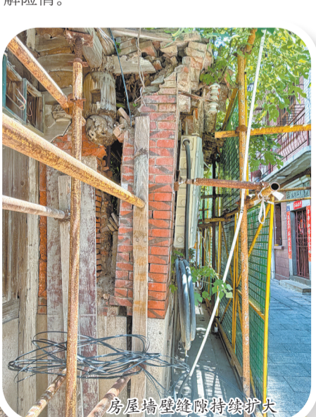
房屋墙壁缝持续扩大

带着居民诉求,记者来到房屋所属的社区了解情况。社区工作人员介绍,因缺少土地使用证,该房屋的修缮工作难以推进。社区此前已协调部门多次对危房开展加固工作,目前也只能再次进行加固,缓解险情。