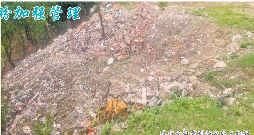
建筑垃圾需到指定地点倾倒

附近多位村民表示，平时除了清明节祭拜先人外，很少来到此处，因此对建筑垃圾一事不知情。不过，大家都认为，此种行为破坏环境，应予以制止，也希望尽快对这些垃圾进行清理。