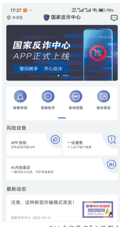
“AI内容鉴定”方便群众

AI伪造图片骗取退款的行为,本质是民事欺诈,若不及时遏制,将威胁电子商务的正常秩序与健康发展。AI鉴真工具能大幅降低商家的辨别成本,既能震慑不法分子,也能作为商家与平台交涉、维护自身权益的有力证据。