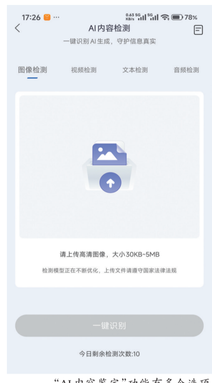
“AI内容鉴定”功能有多个选项