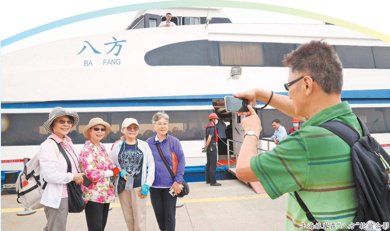
上海旅客在“八方”轮前合影