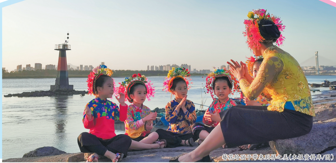
簪花给孩子带来祥瑞之美

样;西街旧馆驿旁的石敢当,模样黝黑沧桑,布满岁月纹理;古榕巷一处民居墙上还藏着“迷你版”石敢当……家长可带着孩子以“寻找不同造型的石敢当”为主题,开启一场趣味十足的古城寻宝游戏。