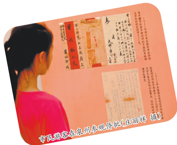
市民游客在泉州参观侨批

侨批既是赡家养亲的经济纽带,也是羁旅天涯的游子向故乡倾诉思念、传递平安的情感载体,更是一部流动的、具有独特美学价值的文本。福建作为中国著名侨乡,现存侨批数以万计。这些泛黄的纸页,正是我们重返历史现场、感受跨文化审美交融的绝佳通道。