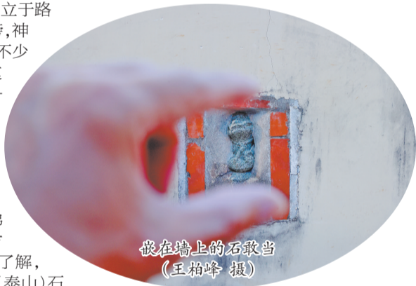
嵌在墙上的石敢当

【亲子贴士】古城里藏有不少特色石敢当:后孝梯巷的石敢当,形貌介于人、狮、虎之间,呈现出一副憨态可掬的“圆”