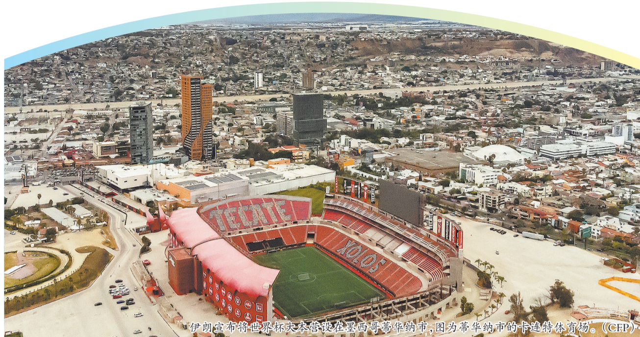
伊朗宣布将世界杯大本营设在墨西哥蒂华纳市,因为蒂华纳市的卡斯特罗体育场。

2026美加墨世界杯定于6月11日至7月19日在美国、加拿大、墨西哥举行,这是首次有48支球队参赛的世界杯,比赛场次也大幅增加至104场。