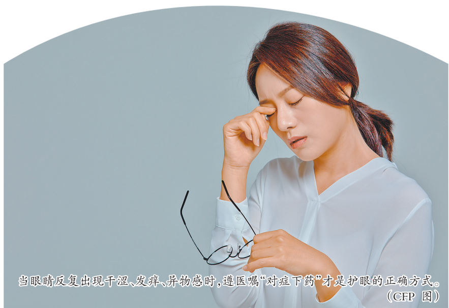
当眼睛反复出现干涩、发痒、异物感时,遵医嘱“对症下药”才是护眼的正确方式。

“眼睛是精密器官,用药无小事。”李贵洲主任表示,当眼睛反复出现干涩、发痒、异物感时,与其在药柜里翻找,不如到医院进行一次正规就诊——遵医嘱“对症下药”,才是护眼的正确方式。