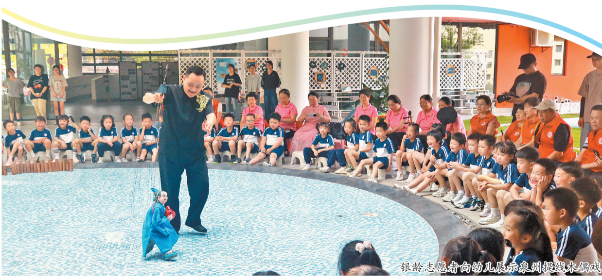
银龄志愿者向幼儿展示泉州提线木偶戏

此外,活动还设置了垃圾分类飞行棋趣味互动游戏和陶艺制作,让孩子们在玩乐中学习环保知识、陶泥技艺。