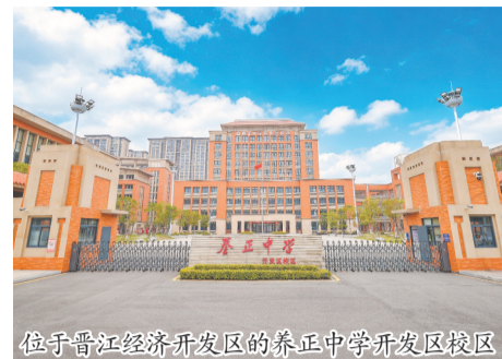
位于晋江经济开发区的养正中学开发区校区

本报讯(融媒体记者许雅玲 文/图)记者从晋江市教育局了解到,今秋,晋江高中教育版图迎来重要扩展,晋江一中象山校区、季延中学新塘校区、养正中学开发区校区等三所名校分校区将于今年9月同步开办高中部,首批各计划招收高一新生220人。