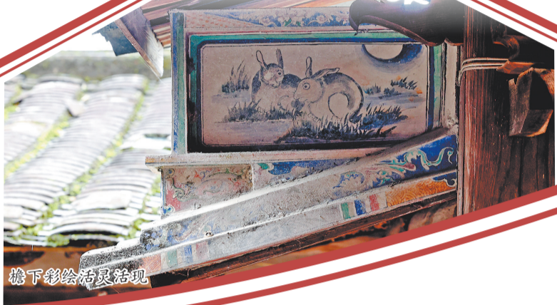
檐下彩绘活灵活现