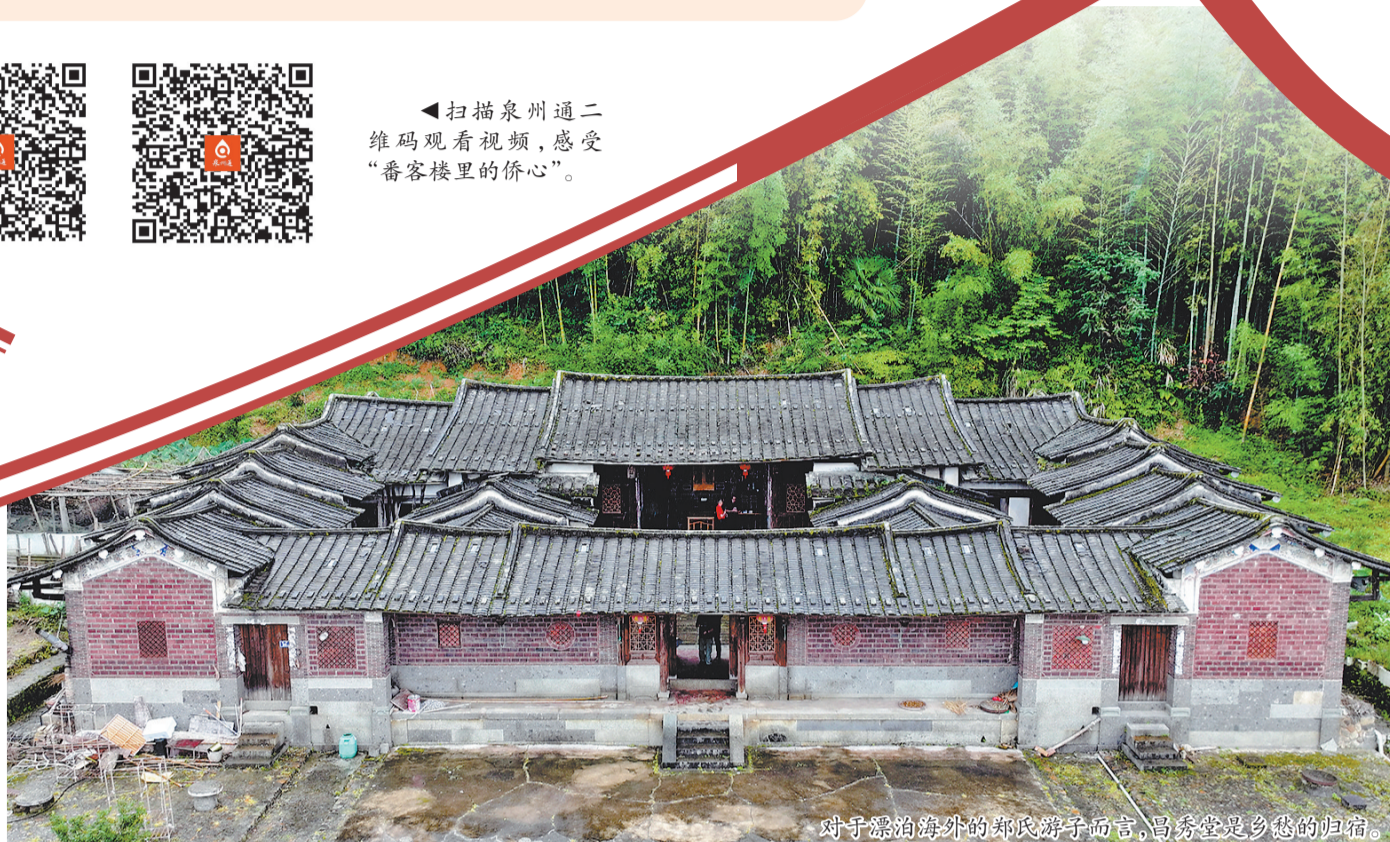
对于漂泊海外的郑氏游子而言,昌秀堂是乡愁的归宿。