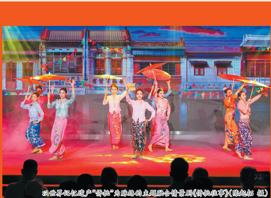
以世界记忆遗产“侨批”为脉络的主题融合情景剧《侨批往事》