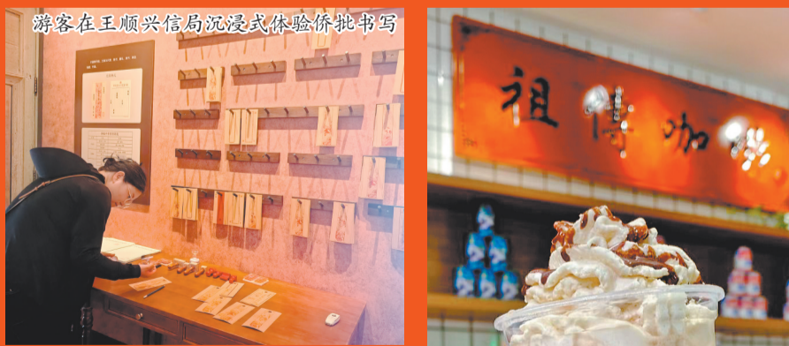
游客在王顺兴信局沉浸式体验侨批书写