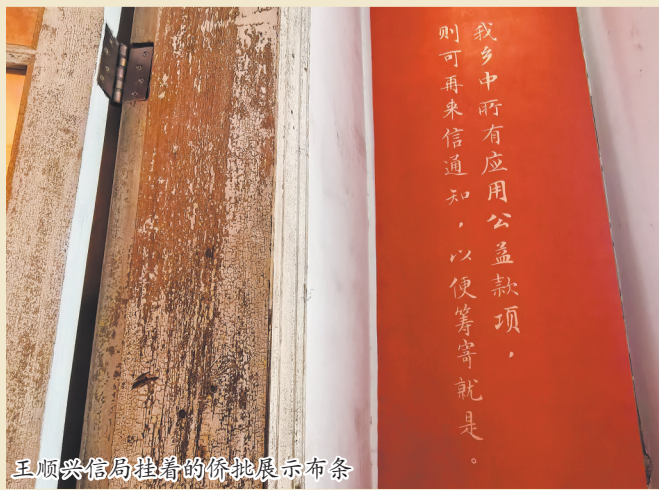
王顺兴信局挂着的侨批展示布条

“时光不言,岁月无情。历经百年流转,大量珍贵侨批档案散落民间,因保存条件有限,正面临受潮破损、虫蛀霉变、遗失散佚、无人传承的困境。大量独一无二的侨批史料正在加速消逝,一旦损毁便永久失传,造成不可弥补的文化损失。抢救濒危侨批、守护侨乡文脉,已刻不容缓、迫在眉睫。”5月23日,泉州市档案馆再次呼吁社会各界同心同行,诚邀携手守护侨乡文脉、聚力抢救濒危侨批遗存。如今,泉州已掀起侨批守护热潮,市民主动翻找老宅旧箱中的祖传侨批、老书信、老票据,无偿捐赠给博物馆、档案馆。私人家书不再藏于“深闺”,而是化作全城共享的文化记忆,让百年侨情代代相传。