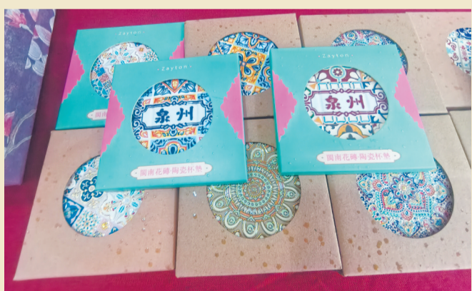
带有南洋风情的花砖杯垫