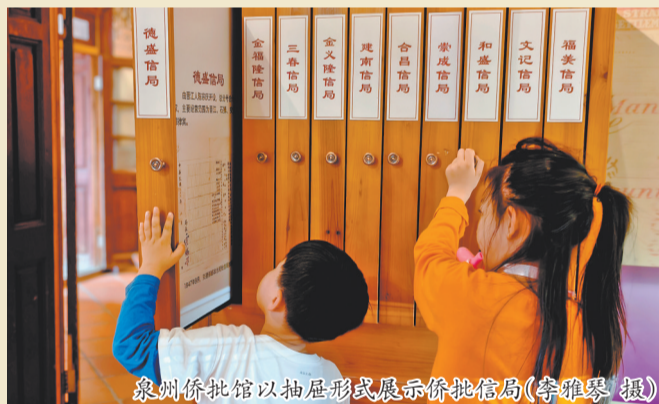
泉州侨批馆以抽屜形式展示侨批信局

凭借珍贵的史料价值,2013年,由广东、福建联合申报的“侨批档案”入选联合国教科文组织《世界记忆名录》,泉州正是其主要分布地,这也让泉州侨乡精神、番客家国情怀,被世界看见、被岁月铭记。