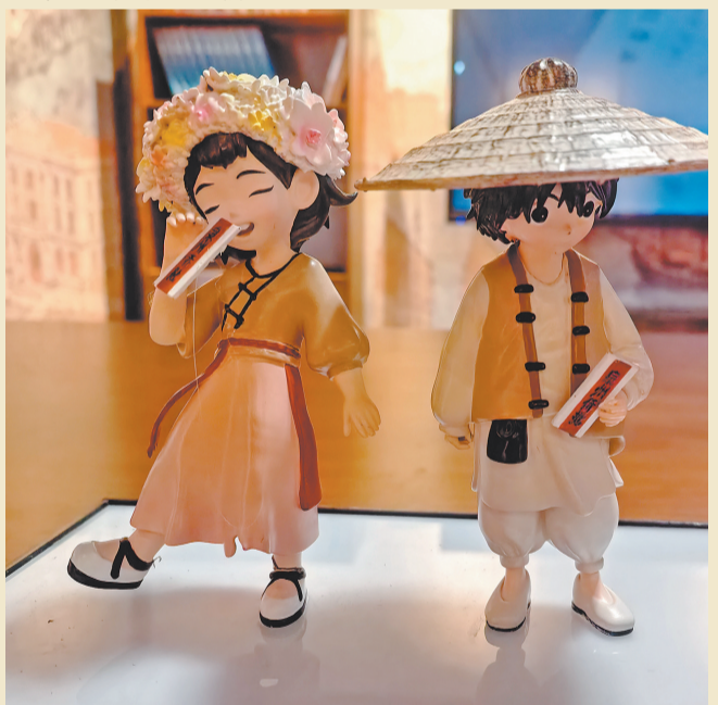
泉州元素“番客”人偶

文创创意活化,让侨批文化走进日常、融入青春。泉州市档案馆携手青春动漫馆,深挖侨批邮戳、手写字体、南洋纹样、海丝元素,创新设计一系列年轻化、潮流化的侨主题文创。从侨批纹样书签、复古书信笔记本,到南洋风情帆布袋、纪念摆件,传统侨批元素与现代审美巧妙融合。曾经仅供专业研究、深藏库房的百年文物,变成年轻人愿意收藏、愿意使用、愿意传播的文创好物。文创为桥,让侨批走出展馆、走入生活,让年轻一代在日常中感受侨乡温情。