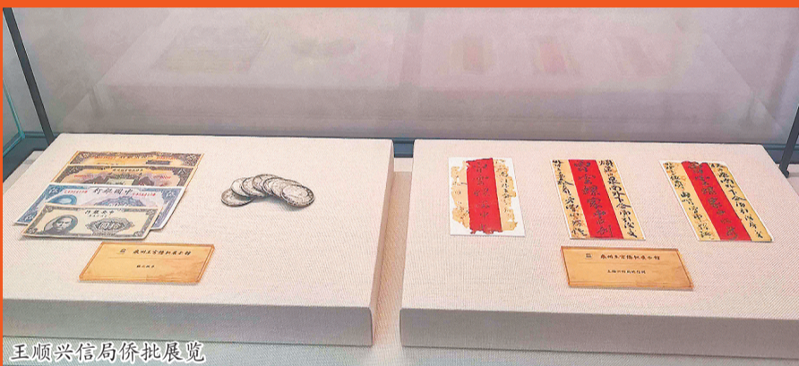
王顺兴信局侨批展览