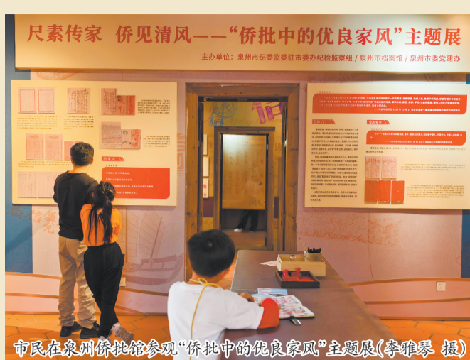
市民在泉州侨批馆参观“侨批中的优良家风”主题展