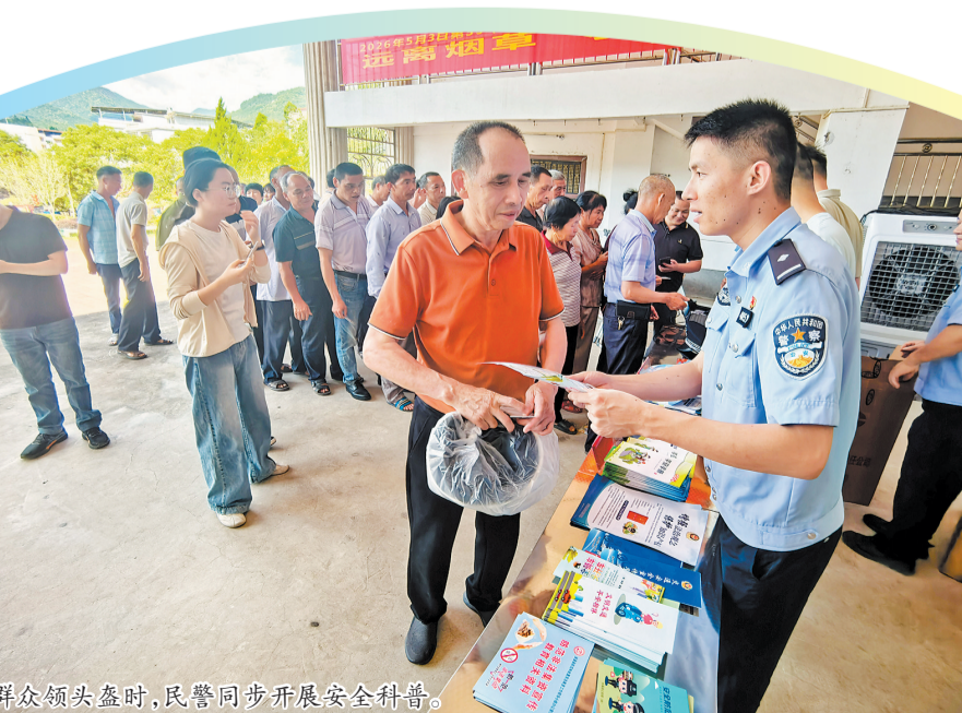
群众领头盔时,民警同步开展安全科普

本报讯(融媒体记者张晓明 通讯员刘伟岗 文/图)“这样的活动很好,我们学到了交通安全知识,还免费领到了头盔!”昨日,在安溪县桃舟乡舟岛广场,村民张大爷高兴地说。据悉,为有效压降涉摩托车、电动自行车道路交通事故,安溪交警大队立足县域交通实际,通过宣传引导、赠盔惠民、精准宣教、路面严管多维发力,打出交通安全综合治理组合拳。