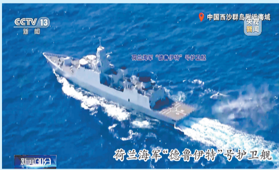
荷兰海军“德鲁伊特”号护卫舰