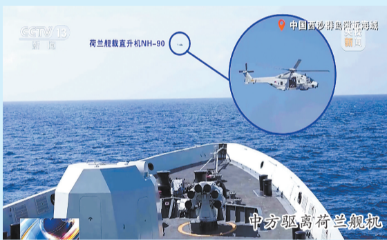
中方驱离荷兰舰机

5月27日,南海来了位不速之客。荷兰海军一护卫舰非法侵入中国西沙群岛,并多次升空舰载直升机侵入我国领空。中国人民解放军南部战区组织航空兵力果断亮剑,对其予以外逼驱离。作为一个欧洲国家,荷兰不远万里派军舰侵入西沙群岛,究竟有何图谋?