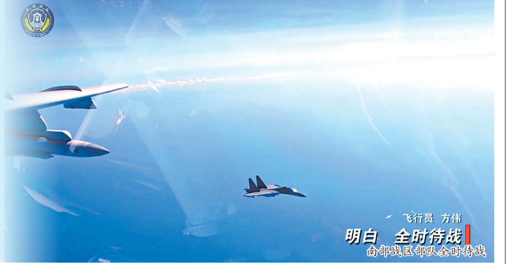
飞行员 方伟 明白 全时待战 南部战区部队全时待战

本报讯 5月31日,中国人民解放军南部战区组织航空兵力位中国黄岩岛领海领空及周边海域开展战备警巡。黄岩岛是中国固有领土。5月份以来,战区部队持续加强黄岩岛领海周边海域巡逻警戒,有力有效应对各类侵权挑衅行径,坚决捍卫国家主权安全,坚定维护南海地区和平稳定。