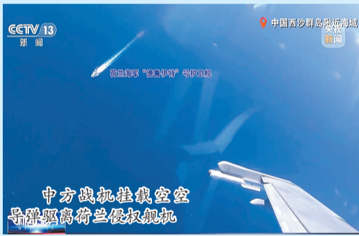
中方战机挂载空空导弹驱离荷兰侵权舰机