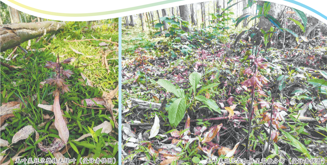
无叶美冠兰整体无绿叶