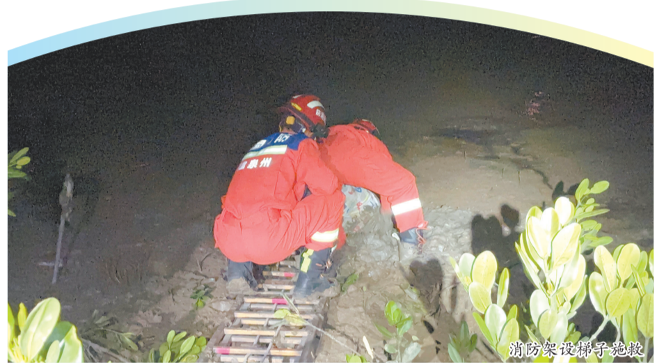
消防架设梯子施救