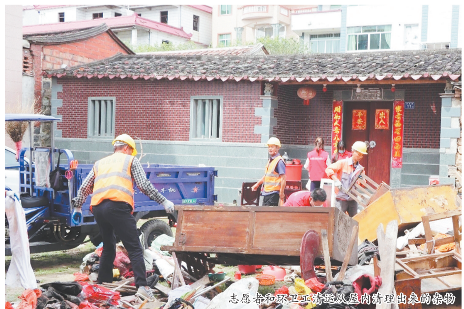
志愿者和环卫工人清运从屋内清理出来的杂物

随后,爱心团队把为母子俩准备的米面粮油、牛奶、麦片、爱心食品礼包等生活物资送进屋,并送上暖心慰问金。老人满脸笑容,连连向所有爱心人士、志愿者表达诚挚谢意。