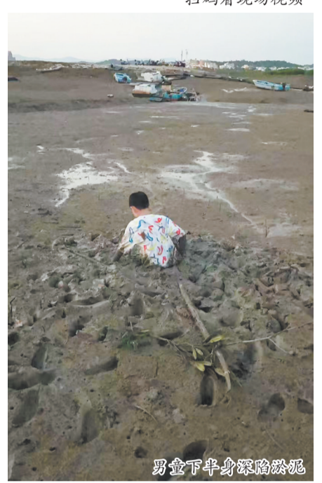
男童下半身深陷淤泥