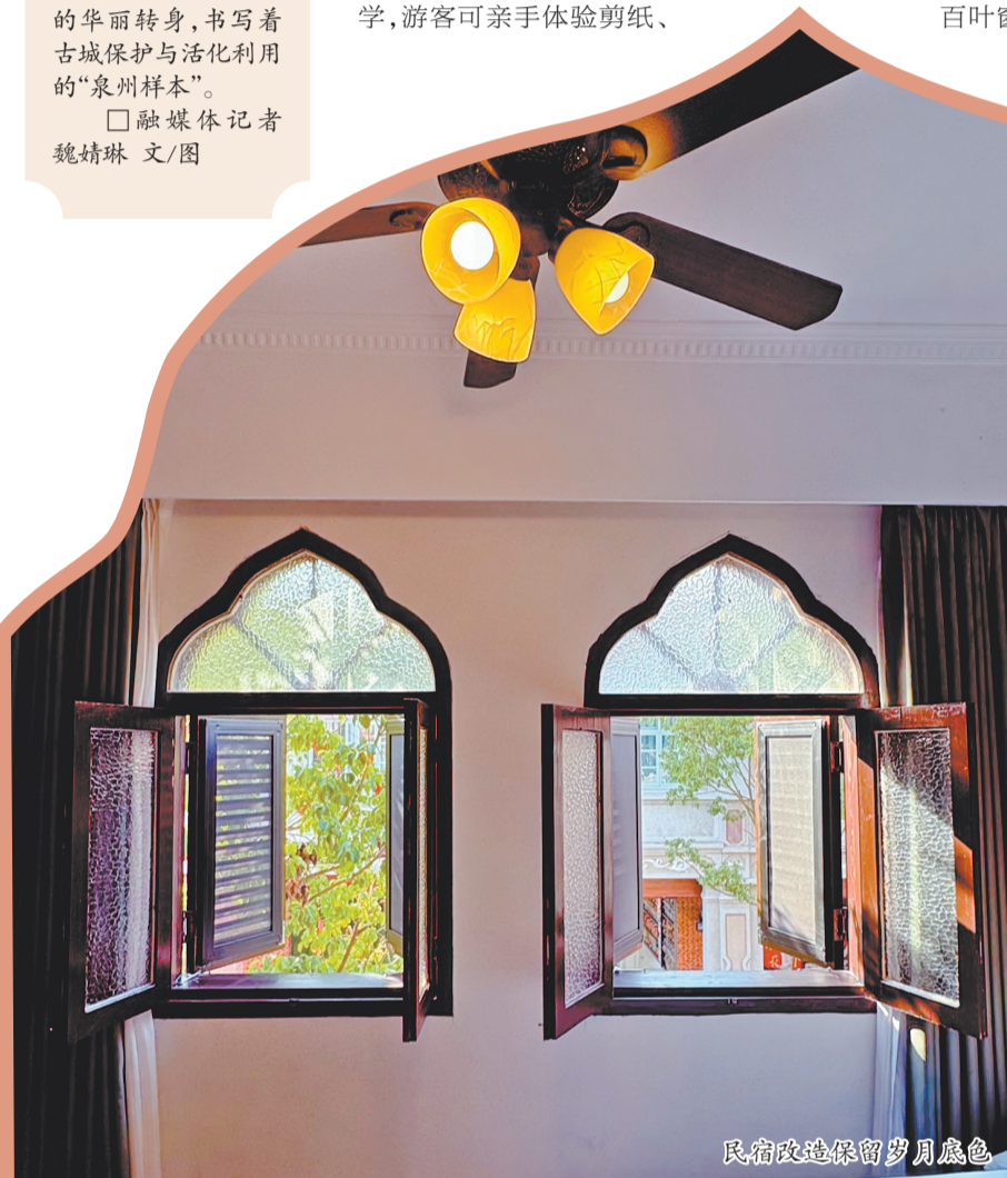
民宿改造保留岁月底色