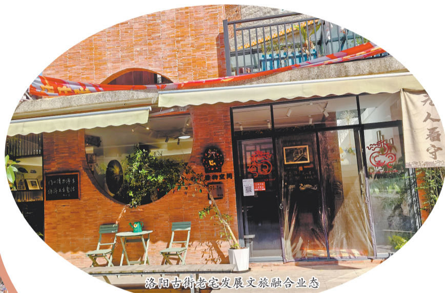
洛厝古街老宅发展文旅融合业态