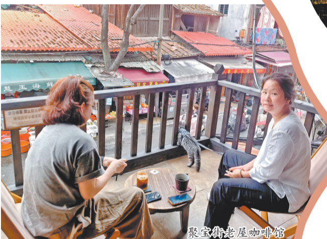
聚宝街老厝咖啡馆