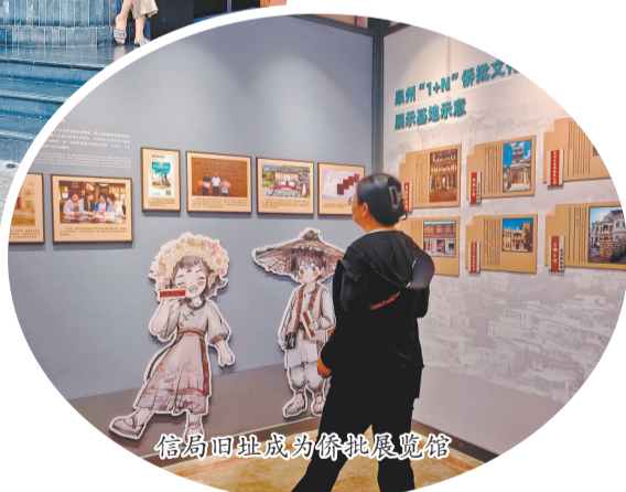
信局旧址成为侨批展览馆