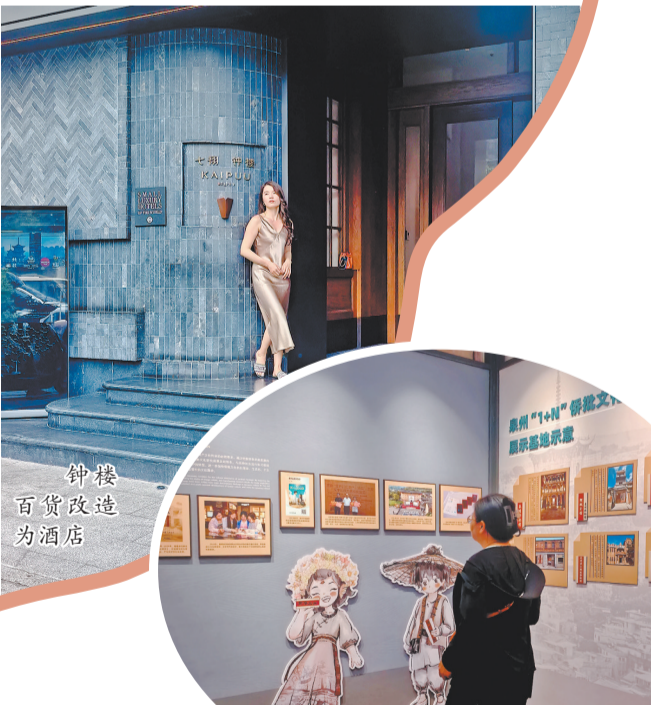
钟楼百货改造为酒店