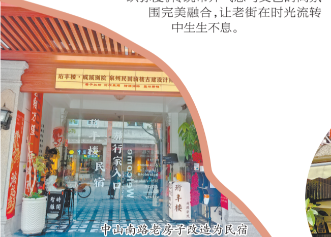
中山南路老房子改造为民宿