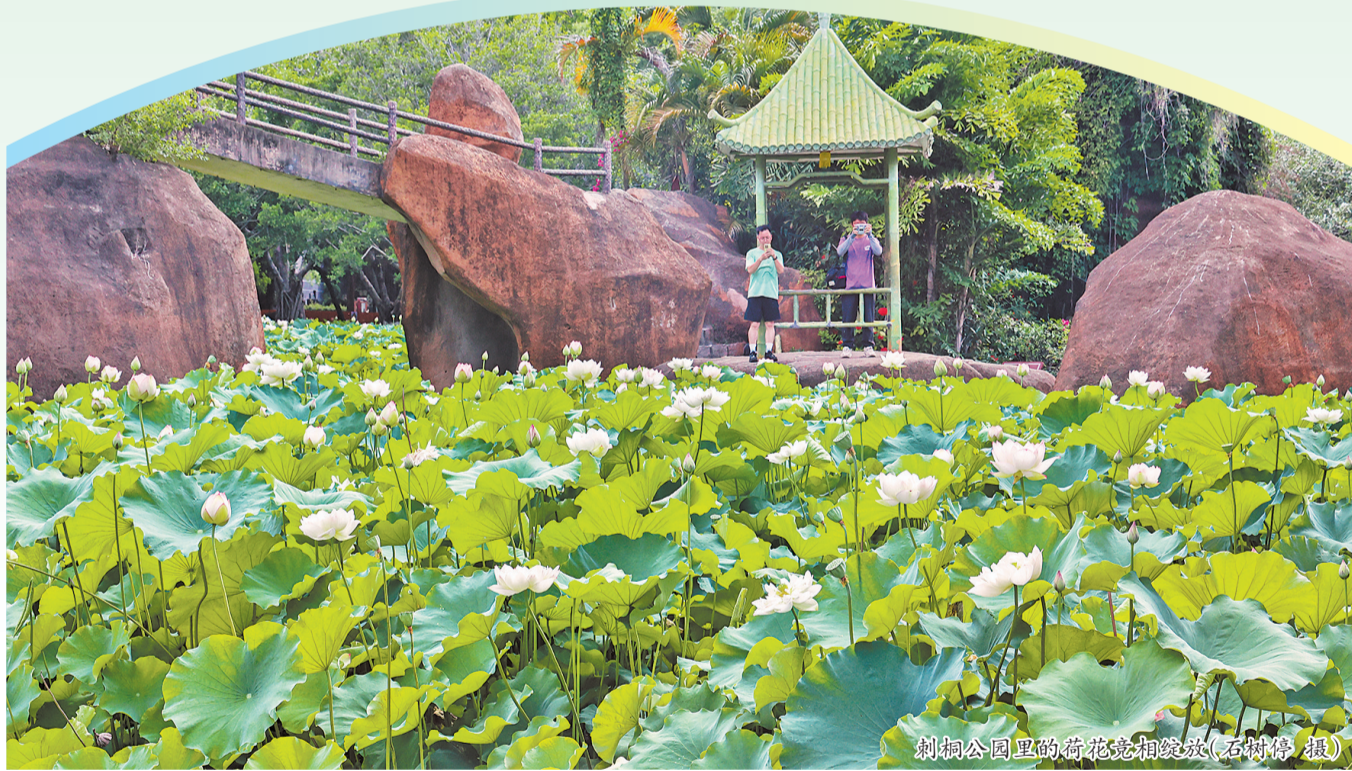
刺桐公园里的荷花竞相绽放