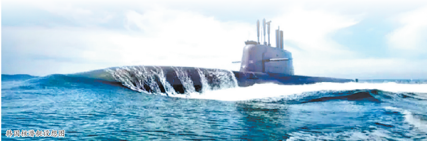
韩国核潜艇设想图

实际上,日本以及由美英澳组成的“奥库斯”联盟最近在水下军事力量发展方面也有新动向。那么,亚太地区的水下暗战为什么会呈现出升级态势?这又会对地区安全格局带来怎样的影响?