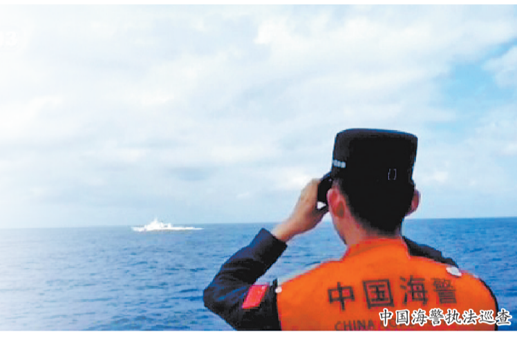
中国海警执法巡查

打通台岛以东执法空白,实现全域管控覆盖。回望过往,我们的海上管控,步步扎实、稳步推进。早年是阶段性巡航,定点值守。2024年实现台岛周边海域常态化巡航。2025年完成环岛执法管控,全域贴身值守。而如今,我们正式站稳台岛以东,补上最后一块管控拼图。