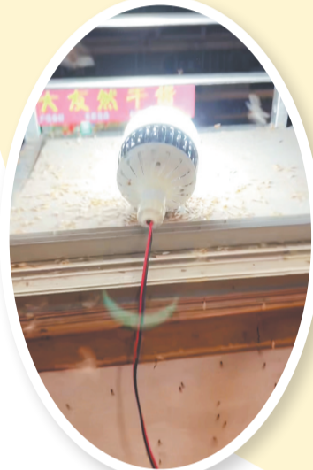
大水蚁有极强的趋光性