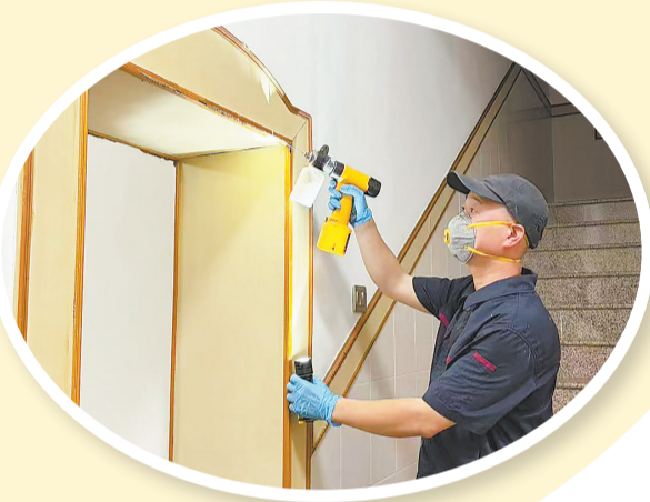
尤师傅上门消杀白蚁