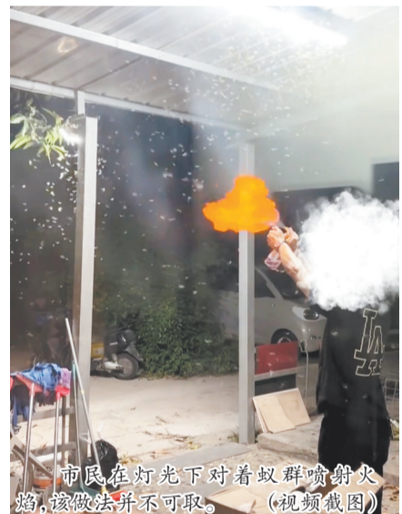
市民在灯光下对着蚁群喷射火焰,该做法并不可取。(视频截图)

此外,老旧木柜、木门板内部也是白蚁高发区,不少住户的柜门从外表看完好,撬开后内里木料已被白蚁蛀空。还有住户家中频繁飞入大水蚁,但排查家中却未发现蚁巢,原来是外面树干内部已成白蚁巢穴,成熟繁殖蚁雨后分飞入户。